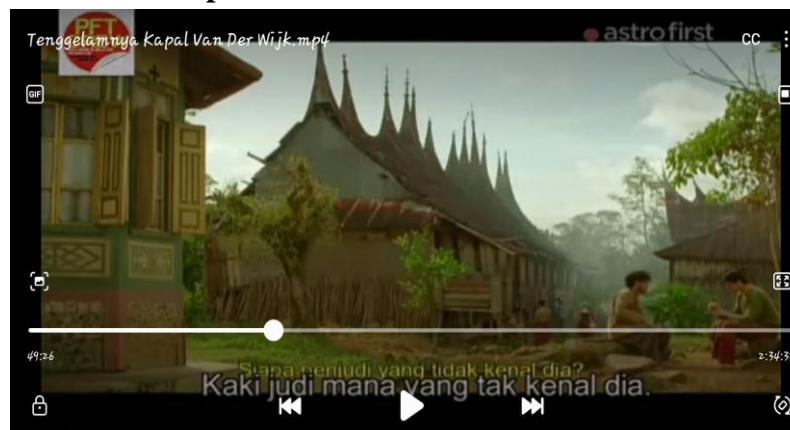
Gambar. 4.8 Adegan Aziz yang suka berjudi dan mabuk-mabukkan pada menit ke 49 detik 26

Zainuddin : Bang muluk tahu? Siapa Aziz?