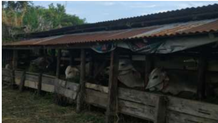
Gambar 4.5 Ternak Sapi