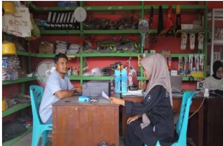
Gambar 4.8 Wawancara dengan direktur BUMNag Bukik Sakumpoa

menjadi motor penggerak pembangunan desa dan meningkatkan kesejahteraan masyarakat secara berkelanjutan.