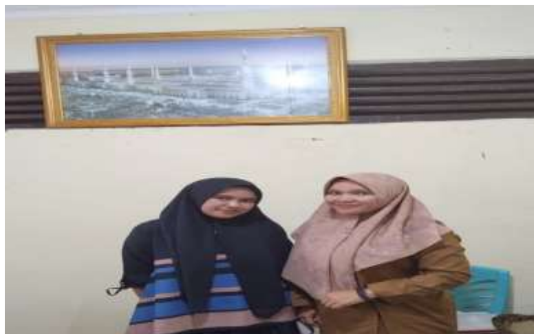
Gambar 4.7 Wawancara dengan kaur pemerintahan Nagari pasie Laweh

Partisipasi masyarakat dalam BUMNag adalah kunci keberhasilan BUMNag dalam meningkatkan kesejahteraan masyarakat. Partisipasi ini mencakup berbagai bentuk, mulai dari perencanaan, pelaksanaan, hingga pengawasan kegiatan BUMNag. Ahli menekankan bahwa partisipasi aktif masyarakat akan membuat BUMNag lebih responsif terhadap kebutuhan dan potensi lokal, serta mendorong rasa memiliki dan tanggung jawab terhadap pengelolaan aset nagari.