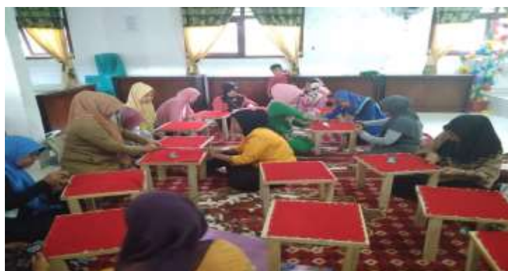
Gambar 4.11 Pelatihan Mejahit Songket