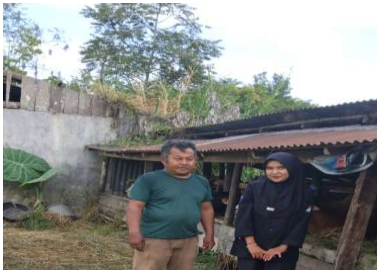
Gambar 4.11 Wawancara dengan masyarakat Nagari Pasie Laweh

jauh-jauh pergi membeli pupuk. Selain itu masyarakat juga terbantu dengan layanan- layanan yang di sediakan BUMNag. Masukan Untuk BUMNag agar pengelola BUMNag lebih sering berada di BUMNag agar masyarakat lebih sering menggunakan jasa jasa yang ada di BUMNag Bukik Sakumpoa tersebut, karena selama ini saya melihat BUMNag sering tutup dan petugas sering tidak ada di tempat”.