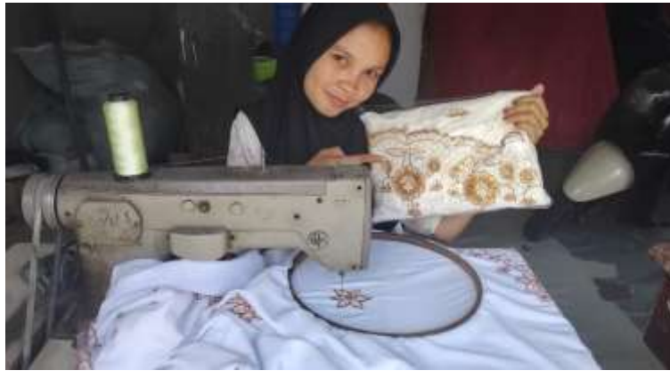
Gambar 4.4 Jahitan Bordir

BUMNag dapat mengembangkan usaha yang memproses produk lokal seperti produk kerajinan (bed cover atau bordir), atau produk pertanian, peternakan.