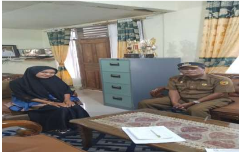
Gambar 4.6 Wawancara dengan wali nagari Pasie Laweh

Berdasarkan hasil penelitian yang peneliti lakukan di Badan Usaha Milik Nagari (BUMNag) Bukik Sakumpoa Nagari Pasie Laweh khususnya mengenai peran badan usaha milik Nagari (BUMNag) Bukik Sakumpoa dalam meningkatkan kesejahteraan masyarakat melalui pengumpulan data berdasarkan observasi dan wawancara.