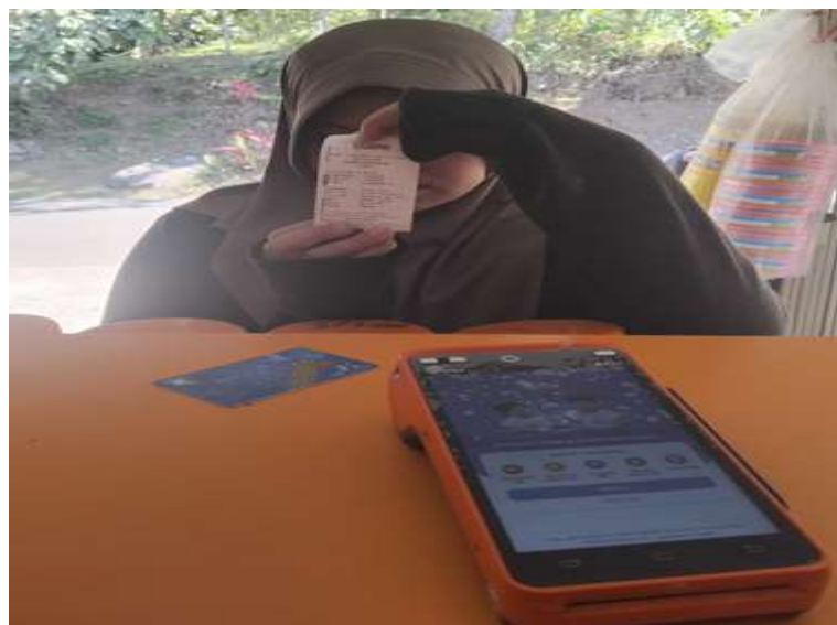
Gambar 4.2 Brilink

BUMNag dapat menyediakan layanan jasa seperti penyewaan alat pertanian dan alat pembangunan (mesin molen), BRI Link untuk pembayaran listrik, token ataupun pulsa HP.