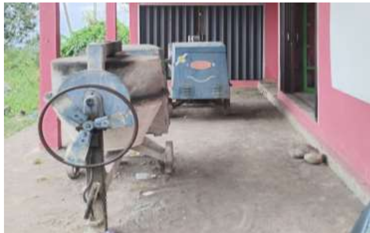
Gambar 4.3 Mesin Molen

Berdasarkan wawancara dengan Kaur BUMNag Pasie Laweh ibuk Yosi pada tanggal 14 April 2025 beliau mengatakan :