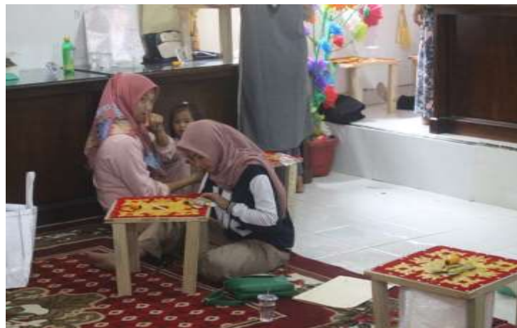
Gambar 4.10 menjahit sonket

BUMNag memiliki peran penting dalam meningkatkan kapasitas sumber daya manusia di nagari melalui penyelenggaraan pelatihan dan program pengembangan keterampilan. Kegiatan ini bertujuan untuk memperkuat kemampuan masyarakat dalam berbagai bidang, seperti wirausaha, serta keterampilan teknis lainnya.