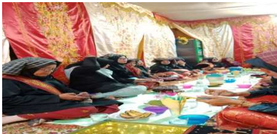
gambar 4. 3 Proses menyeru masak siriah dari bundo kanduang

Hasil wawancara peneliti dengan informan diatas dapat disimpulkan bahwa bentuk komunikasi secara langsung yang terjadi pada saat prosesi bararak tidak terlalu lama dan panjang, komunikasi yang terjadi hanya sekedar memanggil atau menyeru peserta bararak untuk menyicipi hidangan yang telah tersedia, seperti himbauan “masak lah siriah bundo” artinya bundo kanduang si pangka atau bundo kanduang pihak laki-laki memberikan seruan untuk meminum air dan memakan kue yang telah di sediakan, setelah itu bundo kanduang dari pihak perempuan akan menyeru kepada anggota bararak samba 12.