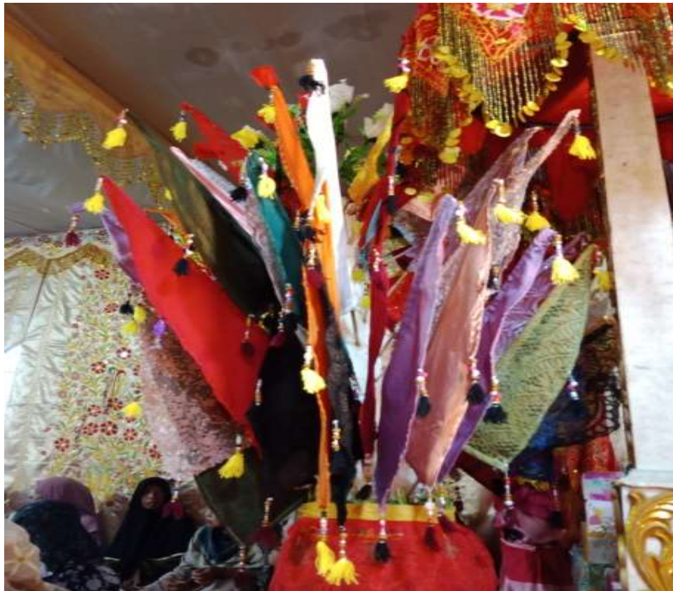
gambar 4 5 Bungo siriah

bernaung di bawah bimbingan Bundo Kandung; lidi berbagai ukuran mencerminkan keberagaman sifat dan perilaku manusia yang harus dipahami dan diarahkan dengan bijaksana; serta kain paco-paco yang menjadi simbol kebijaksanaan dalam menutupi kekurangan dan menjaga marwah diri. Dengan demikian, bungo siriah bukan sekadar pelengkap arak-arakan, tetapi menjadi simbol tanggung jawab, kehormatan, dan jati diri seorang Bundo Kandung dalam menjaga nilai-nilai adat serta membimbing anak kemenakan dan kaumnya.