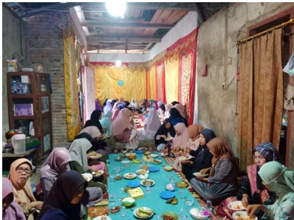
gambar 4 2 Acara maanta siriah pinang dan bararak anak pancau

Data diatas dapat peneliti simpulkan bahwa komunikasi yang dilakukan bundo kanduang sebelum bararak samba 12 terjadi pada saat prosesi pengantaran siriah pinang ke rumah mempelai laki-laki, disana kedua belah pihak bundo kanduang membahas mengenai adat apa yang akan dibawakan dan hari apa akan dilaksanakan kegiatan bararak tersebut.