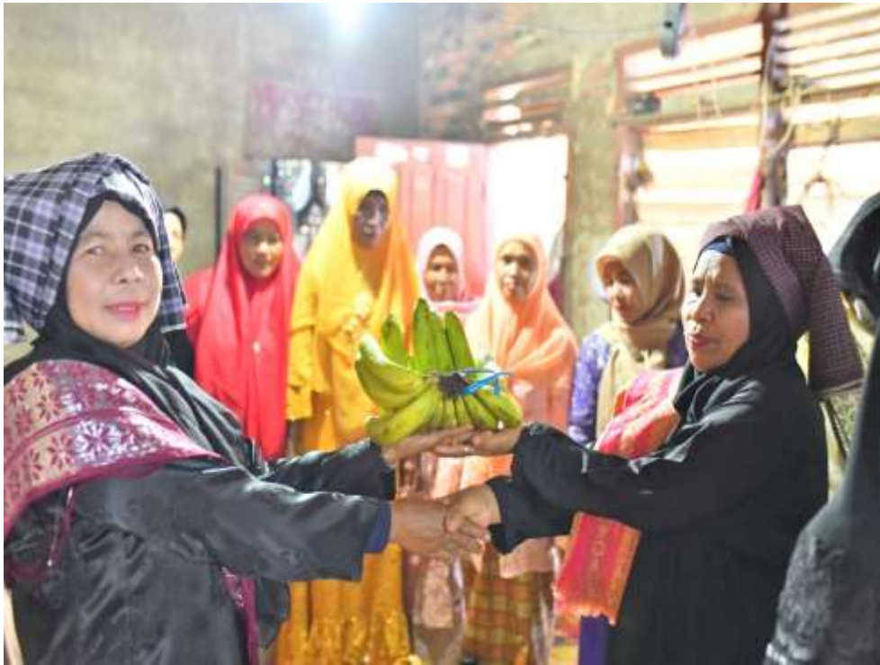
gambar 4 6 Proses pulang tali

dalam tradisi bararak samba 12 telah selesai, sekaligus menutup seluruh rangkaian kegiatan adat secara simbolik dn bermakna. Kesamaan informasi dari seluruh informan menunjukkan adanya kesepahaman budaya dan konsistenan simbolik dalam struktur tradisi ini.