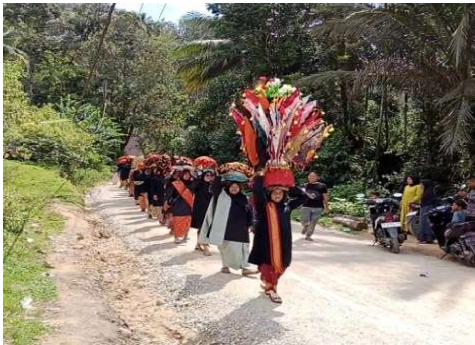
gambar 4. 4 Susunan arak-arakan samba 12

Berdasarkan hasil wawancara dengan lima orang informan, dapat disimpulkan bahwa dalam tradisi Bararak Samba 12 di Nagari Sulit Air, susunan posisi arak-arakan diatur secara adat dan penuh makna simbolis. Bundo Kanduang selalu berada di barisan paling depan, memimpin rombongan sambil membawa siriah pinang atau perlengkapan adat lainnya sebagai lambang pembuka jalan dan penghormatan adat. Di belakang Bundo Kanduang, barisan dilanjutkan oleh para anggota rombongan yang membawa dulang berisi makanan, seperti nasi, sambal, lauk-pauk, dan kue-kue tradisional. Sementara itu, anak daro (pengantin perempuan) bersama para dayang berada di barisan tengah, diapit dan dijaga oleh keluarga sebagai bentuk penghormatan dan perlindungan, serta menandakan posisi sentralnya dalam prosesi pernikahan adat tersebut. Susunan ini mencerminkan struktur sosial, tanggung jawab, dan makna simbolik dalam adat Minangkabau.