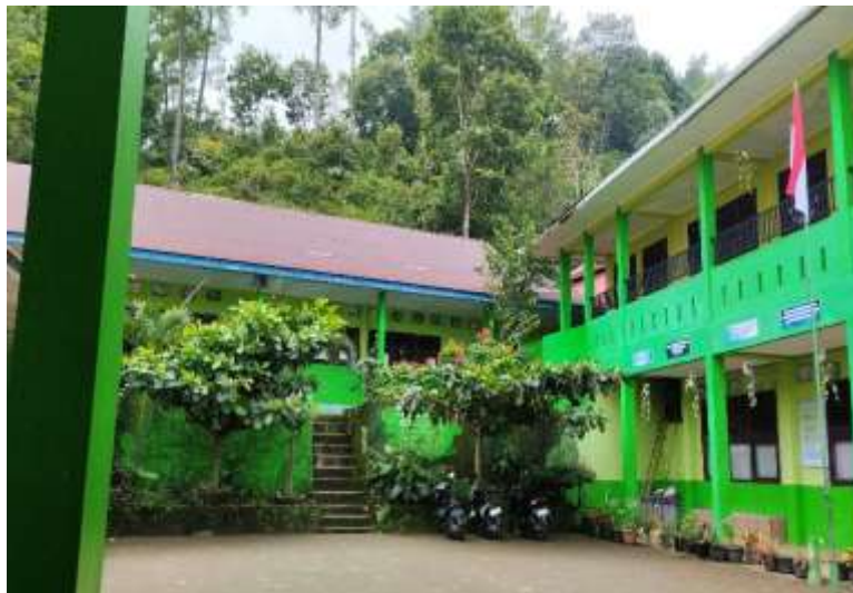
Gambar 4. 1 Sekolah MIN 2 Tanah Datar