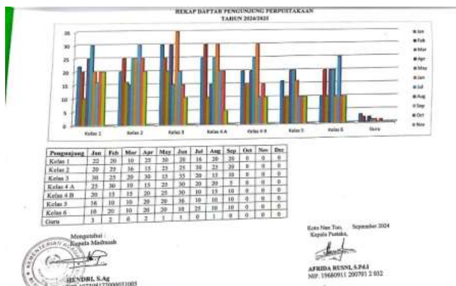
Gambar 4. 4 Daftar kunjungan siswa

Guru sering mendorong siswa untuk mengunjungi perpustakaan supaya bisa mengenalkan berbagai jenis bacaan serta melibatkan perpustakaan dalam proses pembelajaran, seperti memberikan tugas yang mengharuskan siswa mencari informasi di buku perpustakaan, dengan seiring berjalannya waktu siswa yang sebelumnya kurang tertarik membaca sekarang sudah mulai menunjukkan rasa antusiasme untuk mengunjungi perpustakaan. Guru juga mengaitkan pentingnya membaca dengan nilai-nilai keagamaan dan akhlak, mengingat MIN merupakan lembaga pendidikan yang berbasis Islam. Para guru sering menyampaikan bahwa membaca adalah bagian dari menuntut ilmu. Berikut dokumentasi kunjungan siswa ke perpustakaan: