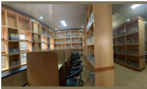
Gambar 4.3 Ruang Baca Umum Dinas Perpustakaan dan Kearsipan Kota Padang Panjang