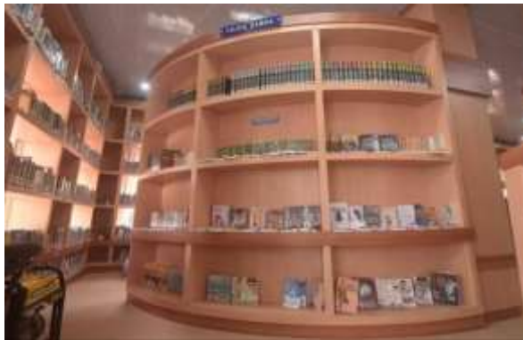
Gambar 4.8 Ruang Pojok Hamka Dinas Perpustakaan dan Kearsipan Kota Padang Panjang

Perpustakaan Daerah Padang Panjang berbeda dari perpustakaan lainnya.