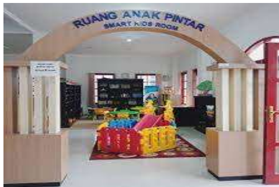
Gambar 4.5 Ruang Baca Anak Dinas Perpustakaan dan Kearsipan Kota Padang Panjang

Perpustakaan Daerah Kota Padang Panjang menawarkan ruang bacaan yang didesain khusus untuk anak-anak. Ruang ini dipenuhi berbagai koleksi buku yang sesuai dengan berbagai usia anak, termasuk buku cerita, buku informasi, dan buku bergambar. Dindingnya dilapisi dengan warna cerah dan ilustrasi menarik untuk menciptakan suasana yang nyaman dan menyenangkan. Area ini juga dilengkapi dengan bantal empuk dan meja kecil untuk membuat anak merasa betah membaca.