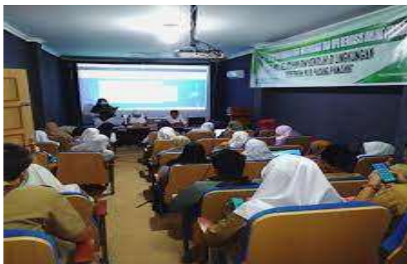
Gambar 4.6 Ruang Audio Visual Dinas Perpustakaan dan Kearsipan Kota Padang Panjang

penyampaian materi oleh pengajar menjadi lebih mudah, bahkan alat ini bisa menggantikan peran pengajar dalam beberapa proses pembelajaran. Cara kerja audio visual meliputi penggunaan slide dengan suara, video, televisi, serta berbagai media lainnya.