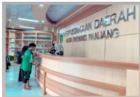
Gambar 4.2 Layanan Sirkulasi Dinas Perpustakaan dan Kearsipan Daerah Kota Padang Panjang

Layanan perpustakaan yang berkaitan dengan peminjaman, pengembalian, dan perpanjangan koleksi buku atau bahan pustaka merupakan layanan sirkulasi. Sirkulasi memungkinkan pengguna perpustakaan untuk mengakses koleksi dan memanfaatkan bahan pustaka sesuai dengan kebutuhan.