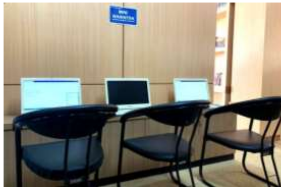
Gambar 4.7 Ruang Warintek Dinas Perpustakaan dan Kearsipan Kota Padang Panjang