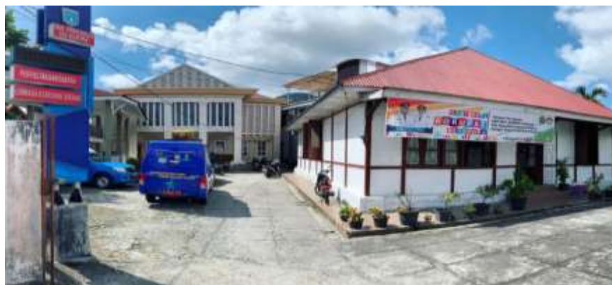
Gambar 4. 1. Gedung Dinas Perpustakaan dan Kearsipan Kota Padang Panjang

Sumatera Barat, tanggal 5 Mei 2018 membawa dampak positif bagi masyarakat Kota Padang Panjang. Gelar sebagai Kota Literasi yang disandang oleh Kota Padang Panjang menginisiasi Perpustakaan Daerah sebagai proyek percontohan dalam pelaksanaan literasi yang berfokus pada inklusi sosial, program yang dicanangkan oleh Presiden Republik Indonesia, Ir. H. Joko Widodo, pada tahun 2018.