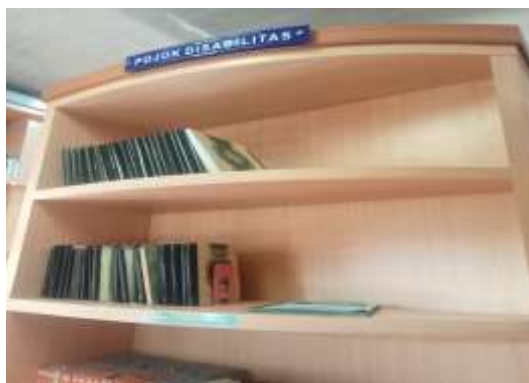
Gambar 4.9 Ruang Disabilitas Dinas Perpustakaan dan Kearsipan Kota Padang Panjang

Perpustakaan Kota Padang Panjang telah menyadari pentingnya memberikan layanan khusus bagi penyandang disabilitas. Program-program seperti penyediaan buku dalam huruf braille dan buku audio sangat membantu dalam meningkatkan aksesibilitas. Selain itu, pelatihan bagi staf perpustakaan tentang cara membantu individu dengan berbagai kebutuhan special juga telah dilakukan. Melalui program-program ini, perpustakaan berupaya memastikan bahwa semua orang, tanpa terkecuali, dapat memanfaatkan layanan yang tersedia.