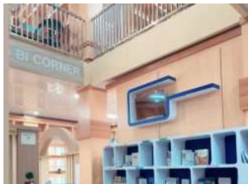
Gambar 4.4 Layanan BI Corner Dinas Perpustakaan dan Kearsipan Kota Padang Panjang

Perpustakaan Kota Padang Panjang adalah salah satu perpustakaan yang memiliki tujuan untuk memenuhi berbagai kebutuhan terkait informasi pemustaka, terutama dalam mencari informasi maupun pembelajaran yang diperlukan.