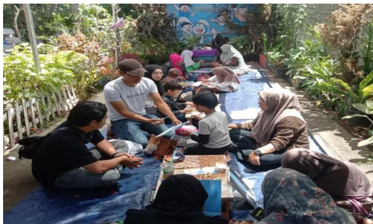
Gambar 4. 2 Mengajarkan Teknik Melukis