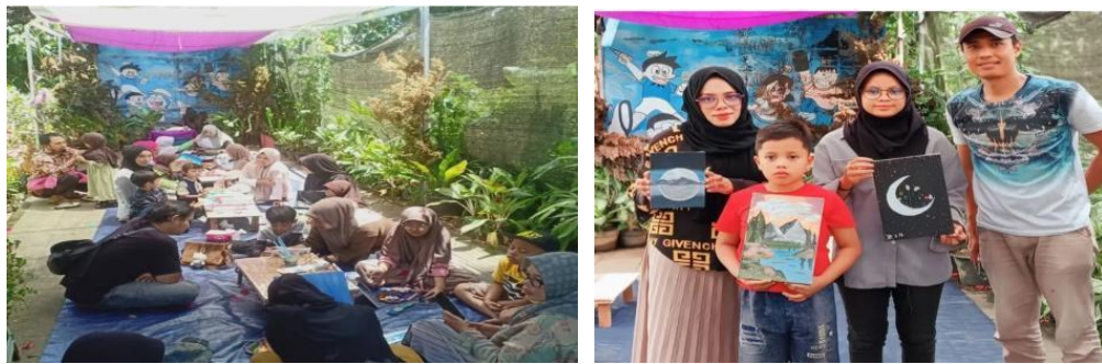
Gambar 1. 2 Kegiatan Mewarnai dan Melukis TBM Mutiara Hati

kebutuhan masyarakat setempat, kegiatan pentas seni yaitu malam puisi untuk remaja dan penggiat literasi sumbar, mengembangkan lagi wadah seni mewarnai dan melukis untuk anak-anak maupun masyarakat, selanjut mengajarkan anak-anak bercocok tanam sejak dini, seperti mengenalkan sayur sayuran, obat-obatan dan tanaman lain. Taman baca masyarakat (TBM) Mutiara Hati juga mengajak masyarakat sekitar bagaimana cara memanfaatkan pekarangan rumah untuk menanam berbagai jenis tanaman seperti menanam sayur, cabe, tomat maupun tanaman lainnya yang nantinya hasilnya bisa untuk keperluan masyarakat itu sendiri.