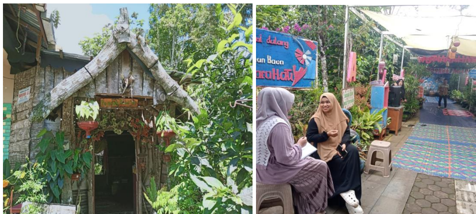
Gambar 4. 1 TBM Mutiara Hati

Nama TBM Mutiara Hati memiliki makna filosofis yaitu kata ‘Mutiara’ seperti mutiara didasar laut meskipun tersembunyi, tetap dicari orang karena memiliki nilai berharga. Seperti halnya dengan TBM meskipun tidak mencolok, berada sudut desa dengan lingkungan sederhana, keberadaannya tetap dicari oleh mereka yang haus akan ilmu. Sementara “Hati” merupakan bahwa setiap kegiatan yang dilakukan dengan hati yang tulus akan mengalir dengan lancar dan membawa manfaat bagi banyak orang.