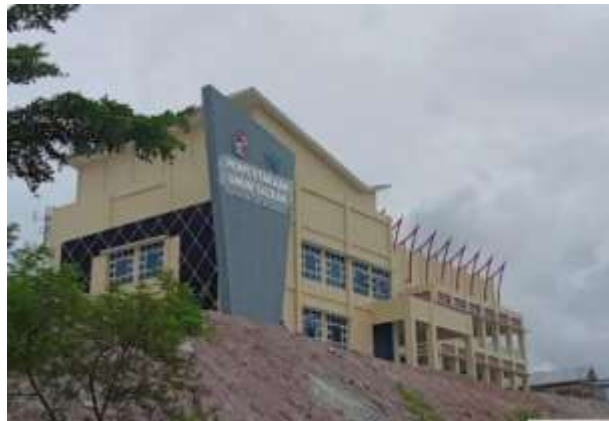
Gambar 4. 1 Gedung Dinas Perpustakaan Umum Daerah Kabupaten Lima Puluh Kota