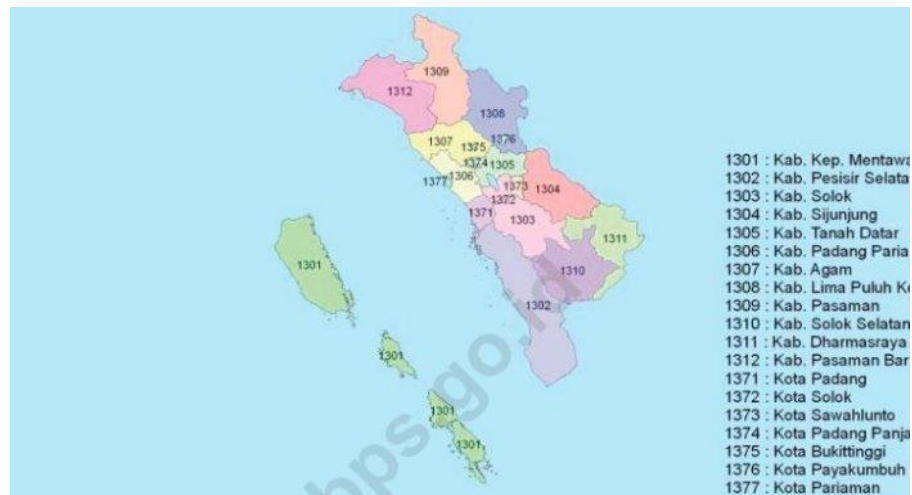
Gambar 4.1 Peta Provinsi Sumatera Barat

Provinsi Sumatera Barat merupakan salah satu Provinsi yang terletak di Pulau Sumatera. Secara geografis Provinsi Sumatera barat terletak diantara 98°36' - 101°53' Bujur Timur dan 0°54' Lintang Utara sampai dengan 3°30' Lintang Selatan, dengan daratan ±42.297,30 Km 2 dan luas perairan (laut)±186.580 Km 2 dengan panjang garis pantai wilayah daratan ±375 Km ditambah panjang garis pantai Kepulauan Mentawai ±1.378 Km. Perairan laut ini memiliki 375 pulau besar dan kecil. Secara administratif, Provinsi Sumatera Barat terdiri dari 19 Kabupaten/Kota (12 Kabupaten dan 7 Kota) yang mempunyai 179 Kecamatan dengan 1.160 Kelurahan/Nagari, dengan batas-batas sebagai berikut: sebelah utara dengan Provinsi Sumatera Utara, sebelah timur dengan Provinsi Riau dan Jambi, sebelah selatan dengan Bengkulu, dan sebelah barat berbatasan dengan Samudera Hindia.