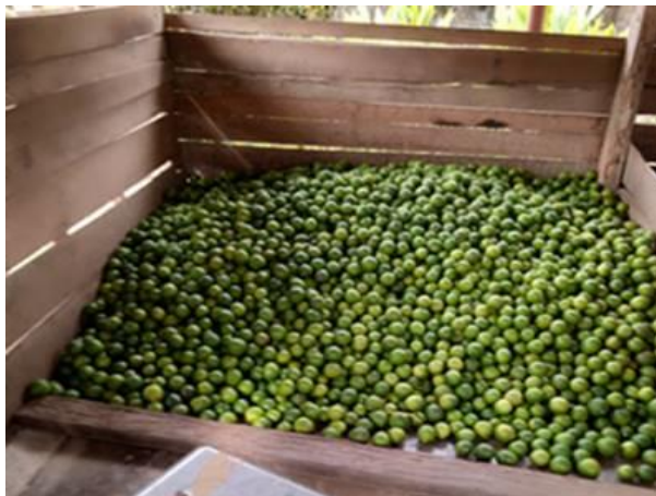
Gambar 4. 1 Hasil panen jeruk nipis

Berdasarkan gambar di atas, salah satu hasil panen petani dari hasil jeruk nipis. Dapat dilihat bahwa panen petani yang di dapatkan dalam satu kali panen memiliki hasil yang cukup lumayan banyak. Menjadi daya tarik bagi petani untuk memiliki usaha jeruk nipis. Di dorong oleh beberapa faktor-faktor ekonomi dan Faktor lingkungan