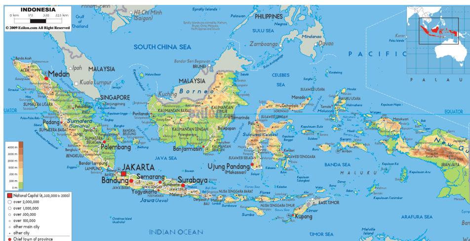
Gambar 4. 1 Peta Indonesia

Secara astronomis, Indonesia berada di antara 6^{\circ} 04' 30'' Lintang Utara hingga 11^{\circ} 00' 36'' Lintang Selatan, serta dari 94^{\circ} 58' 21'' sampai 141^{\circ} 01' 10'' Bujur Timur, dengan garis ekuator yang melintasi wilayahnya pada garis lintang 0^{\circ} . Dari segi geografis, Indonesia berbatasan di utara dengan negara-negara seperti Malaysia, Singapura, Vietnam, Filipina, Thailand, Palau, dan Laut Cina Selatan; di selatan berbatasan dengan Australia, Timor Leste, dan Samudera Hindia; di barat berbatasan dengan Samudera Hindia; serta di timur berbatasan dengan Papua Nugini dan Samudera Pasifik. Indonesia memiliki luas wilayah sekitar 1.910.931,32 km 2 dan terdiri atas 17.504 pulau. Titik paling barat Nusantara berada di Sabang, titik paling timur di Merauke, titik paling utara di Miangas, dan titik paling selatan di Pulau Rote. Negara ini terdiri dari 81.626 desa, 7.024 kecamatan, dan 98 kota, yang tersebar di lima pulau besar serta empat gugusan kepulauan.