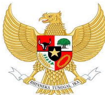
Gambar 4. 2 Lambang Negara Indonesia

Burung Garuda dipilih sebagai lambang negara Indonesia untuk menggambarkan Indonesia sebagai bangsa yang besar dan negara yang kuat, serta melambangkan kekuatan dan energi dalam pembangunan. Warna burung garuda yang keemasan melambangkan keagungan dan kejayaan. Dalam gambar di atas juga menjelaskan tentang sejarah Indonesia waktu kemerdekaan NKRI yakni 17 Agustus 1945.