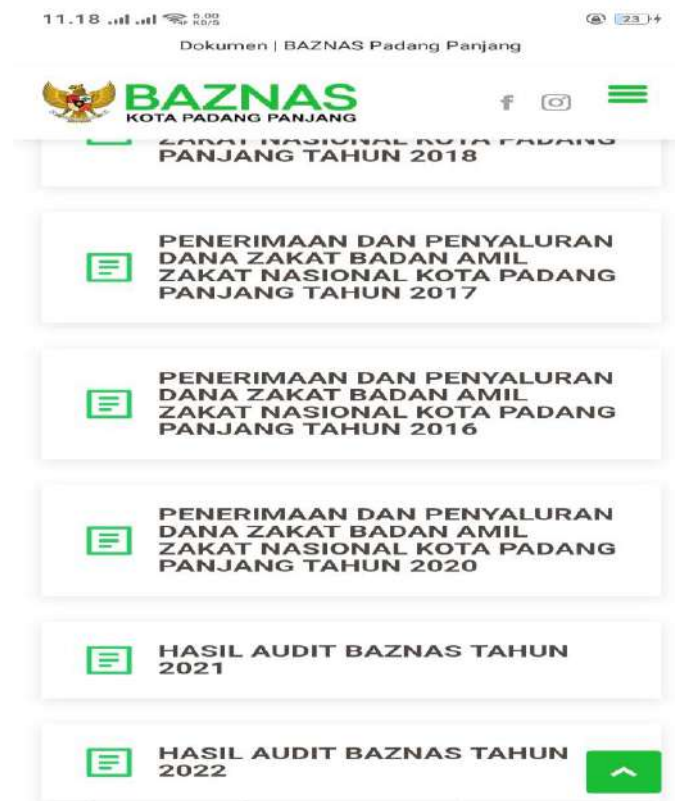
Gambar 4.4 Situs Website BAZNAS Kota Padang Panjang