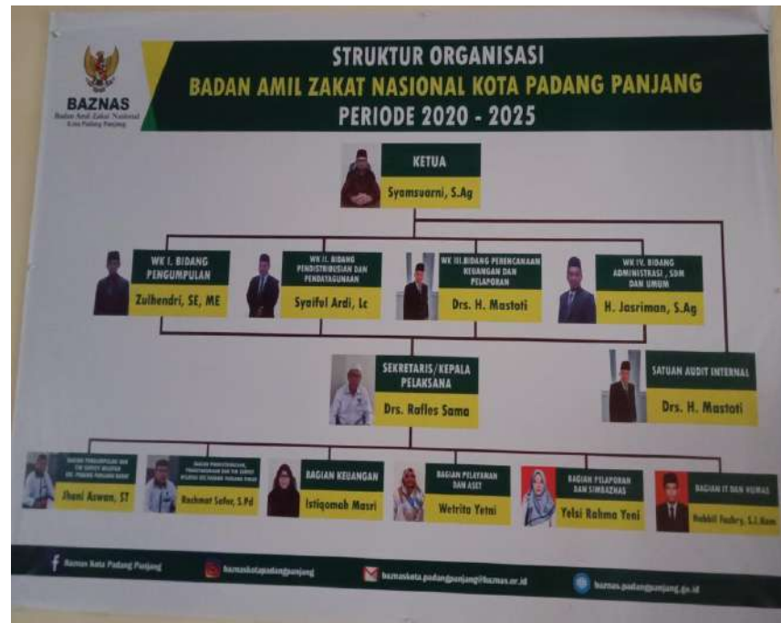
Gambar 4.1 Stuktur Organisasi BAZNAS Kota Padang Panjang

. Berdasarkan peraturan pemerintah Nomor 14 Tahun 2014 tentang pelaksanaan Undang-Undang nomor 23 Tahun 2011 tentang pengelolaan zakat pasal 41 ayat (1) berbunyi : BAZNAS kabupaten/ Kota terdiri dari unsur pimpinan dan pelaksana. Berikut adalah tugas masing-masing posisi kerja di BAZNAS Kota Padang Panjang: