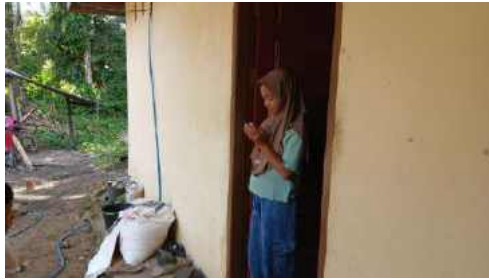
Anak membaca do'a sebelum keluar rumah