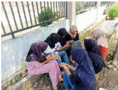
Anak bermain di depan rumah dengan pakaian yang sopan dan tertutup