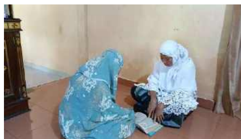
Anak mengaji bersama orang tua setelah sholat magrib