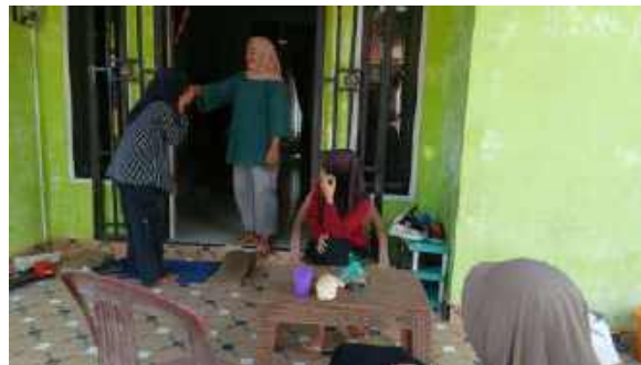
Gambar 4. 2 Observasi anak salam sebelum keluar rumah

Peneliti juga menanyakan kepada anak terkait pertanyaan ini, informan VII menyatakan. “Ada. Di rumah selalu diingatkan ketika berjumpa dengan orang lain harus menyapa. Ketika diajak pergi ke acara mendo’a selalu diingatkan ketika berjumpa orang jangan lupa disapa dan senyum” (Alya, 22 Juni 2025).