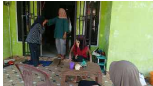
Anak salam dengan orang tua