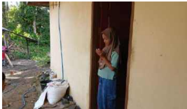
Gambar 4. 1 Observasi anak membaca doa sebelum keluar rumah

Peneliti juga menanyakan terkait do'a ini kepada anak, informan VIII menyatakan. “Ada do'a sebelum makan, sebelum tidur dan ketika keluar rumah. Ketika mau makan, anak selalu diingatkan untuk membaca do'a” (Malik, 20 Juni 2025).