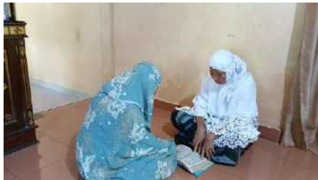
Gambar 4. 5 Observasi orang tua mengajak anak mengaji setelah sholat

Peneliti juga menanyakan hal tersebut kepada anak, hasil wawancara yang peneliti lakukan dengan informan XI, menyatakan. “Di rumah, selalu diajak dan disuruh untuk sholat. Jika sholat tidak dilakukan, akan dinasehati jika tidak sholat akan mendapatkan dosa dan sholat itu adalah bekal yang akan dibawa jika sudah eninggal nanti” (Aben, 21 Juni 2025).