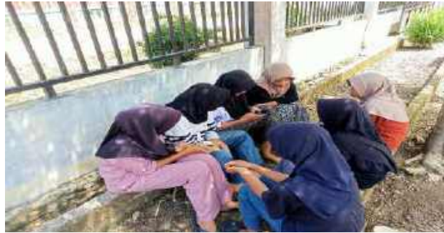
Gambar 4. 3 Observasi anak berpakaian yang sopan dan menggunakan hijab

Berdasarkan pernyataan yang diberikan oleh informan X dan informan I, dapat disimpulkan bahwa yang dilakukan oleh informan X untuk mengajarkan anak dalam berpakaian dilakukan dengan cara memberikan contoh bagaimana berpakaian yang baik itu ketika keluar rumah. Berbeda dengan yang dilakukan oleh informan I yaitu tidak membelikan anak pakaian-pakaian yang terbuka dan selalu membelikan pakaian yang tertutup dan sopan.