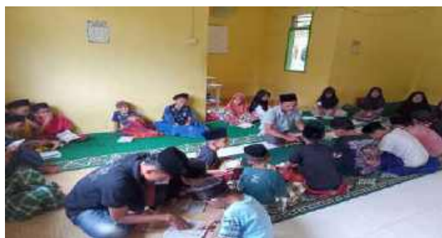
Gambar 4. 4 Observasi anak mengaji bersama di surau

Kemudian peneliti juga menanyakan kepada bapak wali terkait apakah keadaan nagari mendukung untuk mengembangkan karakter religius anak. Hasil wawancara yang peneliti lakukan dengan informan XIII menyatakan. “Lingkungan di nagari ini mendukung dalam membentuk karakter anak,, karena pengaruh luar seperti pergaulan bebas atau alkohol itu belum begitu marak di nagari Maloro” (Silam, 18 Juni 2025).