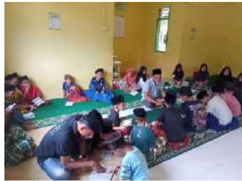
Anak mengaji bersama di surau