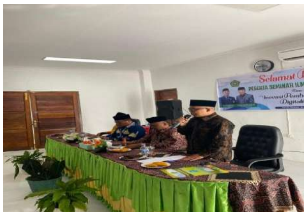
Gambar 4. 2 Seminar Expo MAN 2 Kota Padang Panjang

Adapun program hasil pelaksanaan dapat dilihat dalam lampiran yang menjadi satu kesatuan dalam tesis ini.