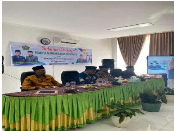
Seminar Ilmiah Expo Man 2 Kota Padang Panjang