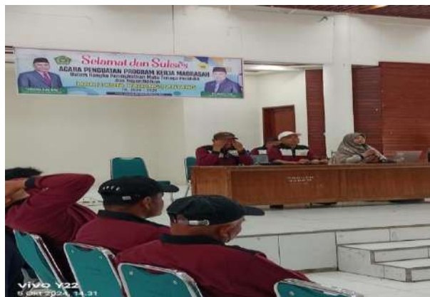
Gambar 4. 1 Loka karya MAN 2 Kota Padang Panjang

Untuk meningkatkan mutu lulusan MAN 2 Kota Padang Panjang membuat sebuah aturan dan ketetapan dalam penerimaan peserta didik baru, yaitu dengan memberikan batas minimum nilai 85 yang akan diterima di MAN 2 Kota Padang Panjang. Penerimaan peserta didik baru dilakukan melalui 2 macam yaitu PPDB dan SNPDB. Inilah yang membedakan MAN 2 Kota Padang Panjang dengan madrasah lainnya di sekitar Sumatera Barat.