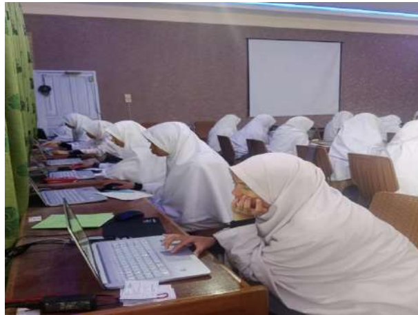
Observasi Siswa Sedang Ujian Tengah Semester