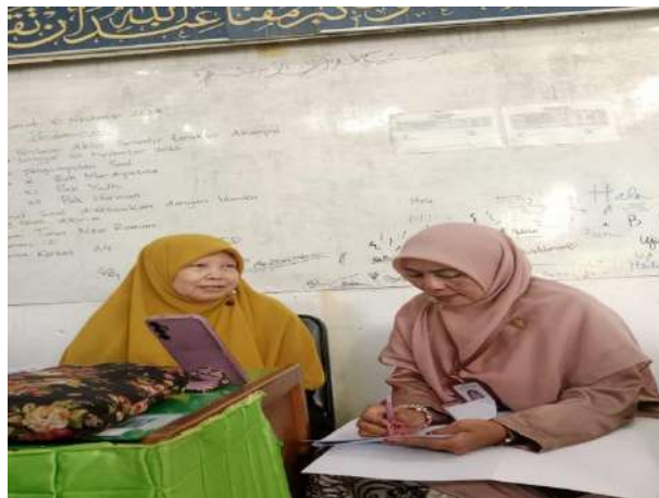
Wawancara dengan Guru Senior (Mata Pelajaran Biologi)