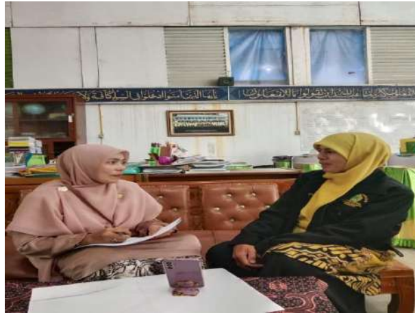
Wawancara dengan Guru Senior (Mata Pelajaran SKI)