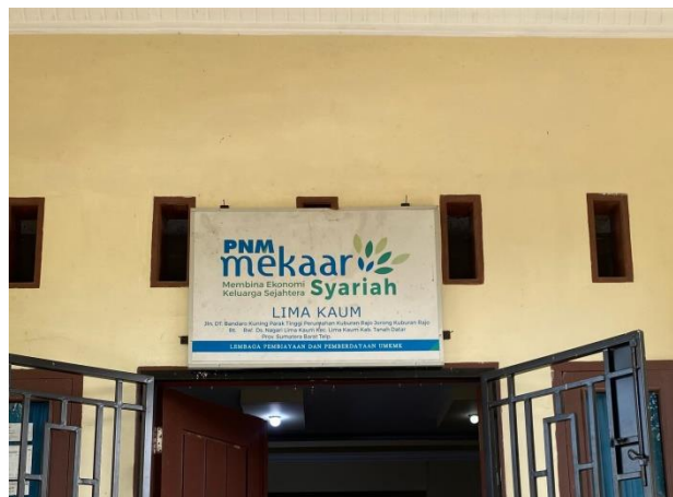
Gambar 4. 3 Logo Kantor PNM Mekaar Syariah Lima Kaum