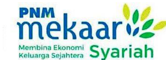
Gambar 4. 2 Logo PNM Mekaar Syariah