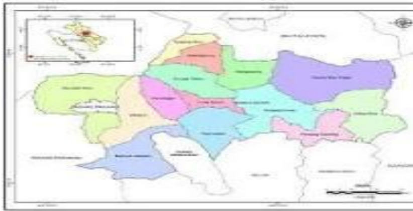
Gambar 4. 1 Peta Kabupaten Tanah Datar

Secara geografis Kabupaten Tanah Datar berada pada posisi 00^{\circ} 17' \text{ LS} - 00^{\circ} 39' \text{ LS} dan 100^{\circ} 19' \text{ BT} - 100^{\circ} 51' \text{ BT} . Kondisi geografis Kabupaten Tanah Datar yang berada diapit oleh tiga gunung sekaligus yaitu gunung singgalang, gunung sago dan gunung merapi. Terdapat satu buah danau yang cukup luas. Dapat dilihat dengan jelas pada gambar peta berikut :