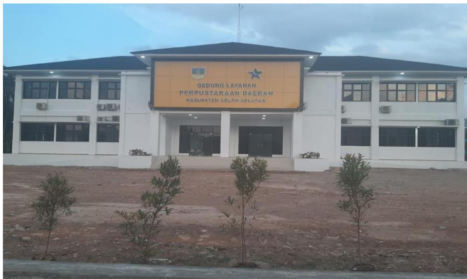
Gambar 4. 1 Perpustakaan solok selatan

Dinas Perpustakaan dan Kearsipan Kabupaten Solok Selatan, dalam pelaksanaan program pembangunan tahunan di bidang perpustakaan dan kearsipan daerah melekat satu kewajiban dalam memper tanggungjawabkan hasil pelaksanaan pembangunan yang telah dilaksanakan sesuai dengan Peraturan Daerah Kabupaten Solok Selatan Nomor 15 Tahun 2016, tentang Pembentukan dan Susunan Perangkat Daerah.