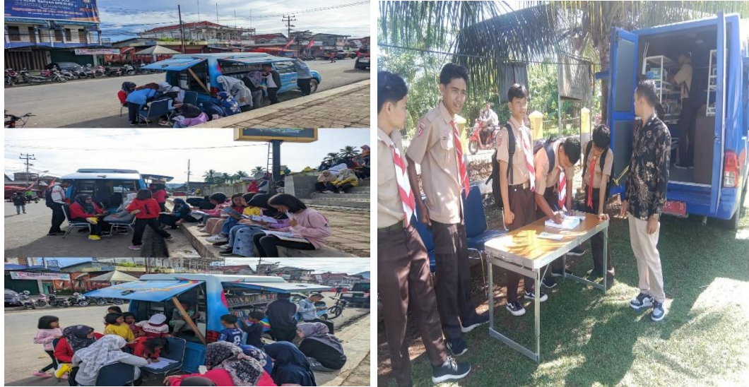
Gambar1.1 kegiatan perpustakaan keliling

promosi perpustakaan keliling Dinas Perpustakaan dan Kearsipan Kabupaten Solok Selatan :