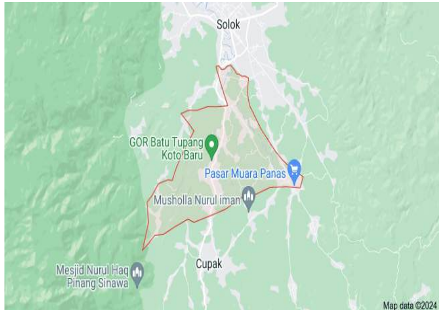
Gambar 3. 1 Denah Nagari Koto Baru

Menurut tradisi Minangkabau, Nagari Koto Baru adalah bagian dari wilayah Luhak Kubuang Tigo Baleh. Di dalam wilayah ini terdapat tiga nagari utama: 9 Korong Solok, 13 Jorong Salayo, dan Koto Nan Anam (yang sekarang dikenal sebagai Koto Anau, Lembang Jaya, Solok). Nagari Salayo kemudian dibagi menjadi dua bagian nagari yang berbeda, yaitu Salayo dan Koto Baru. Hingga sekarang, penduduk asli Koto Baru biasanya memiliki hubungan keluarga yang dekat dengan penduduk Salayo. Mereka juga memiliki aset seperti rumah tradisional Minangkabau (rumah gadang), tanah, kebun, dan sawah di Salayo, begitu juga sebaliknya.