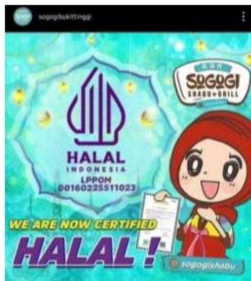
Gambar 4.2 : Logo Halal dan Nomor LPPOM Sogogi Bukittinggi

Suryadi Rahmat menyatakan sebelum Sogogi Shabu & Grill Bukittinggi resmi beroperasi, restoran ini sudah memastikan bahwa bahan makanan yang digunakan telah memenuhi standar halal. Surat edaran sertifikasi halal yang diberikan kepada Sogogi Shabu & Grill Bukittinggi dari pihak Sogogi Shabu & Grill pusat baru diterima setelah kurang lebih lima bulan sejak restoran tersebut berdiri pada akhir November 2022. Proses ini memerlukan waktu karena restoran tersebut harus menunggu penyelesaian administrasi dan verifikasi dari Sogogi Shabu & Grill Pusat terkait kehalalan bahan makanan dan proses pengolahannya. (wawancara Suryadi, 2024)