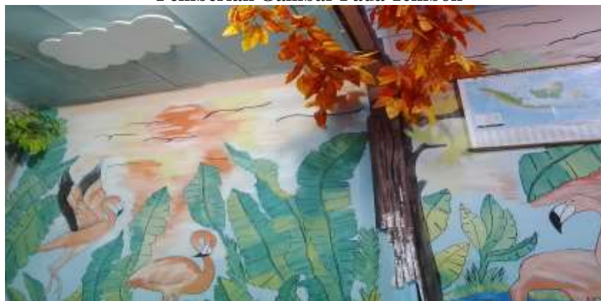
Gambar 4.2. Pemberian Gambar Pada Tembok