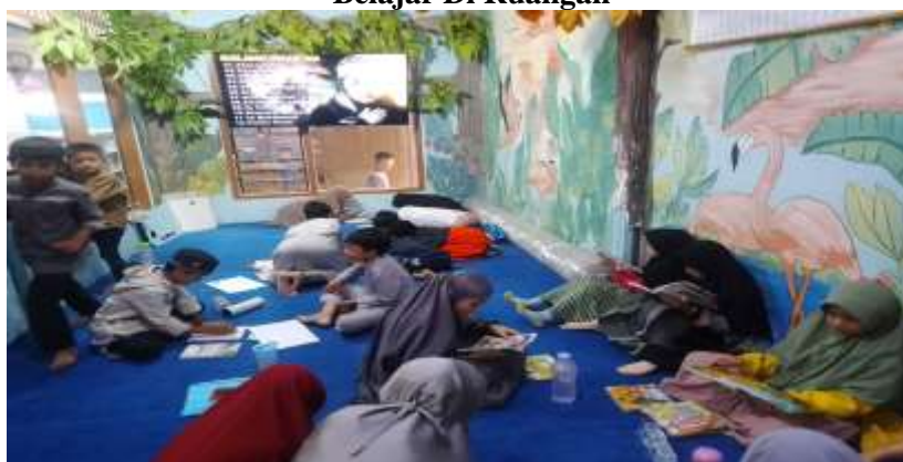
Gambar 4.3. Belajar Di Ruangan