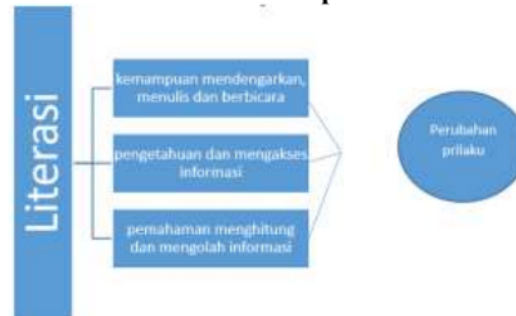
Gambar 2.1 Konsep Literasi

Berdasarkan gambar 1.2 disimpulkan literasi merupakan kemampuan, pengetahuan dan pemahaman yang dimiliki oleh individu terhadap sesuatu hal yang akan mengubah perilaku individu tersebut (Pusat Kajian Strategis: 2019).