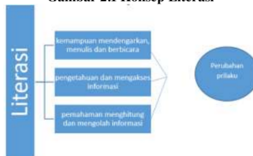
Gambar 2.1 Konsep Literasi

Sumber: Pusat Kajian Strategis (2019) di olah Berdasarkan gambar 1.2 disimpulkan literasi merupakan kemampuan, pengetahuan dan pemahaman yang dimiliki oleh individu terhadap sesuatu hal yang akan mengubah perilaku individu tersebut (Pusat Kajian Strategis: 2019).