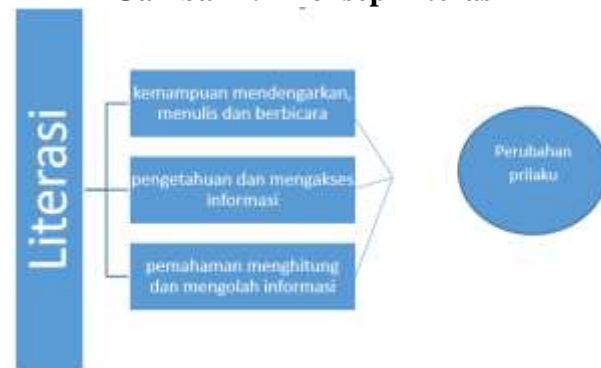
Gambar 2.1 Konsep Literasi

Berdasarkan gambar 1.2 disimpulkan literasi merupakan kemampuan, pengetahuan dan pemahaman yang dimiliki oleh individu terhadap sesuatu hal yang akan mengubah perilaku individu tersebut (Pusat Kajian Sratigis: 2019).