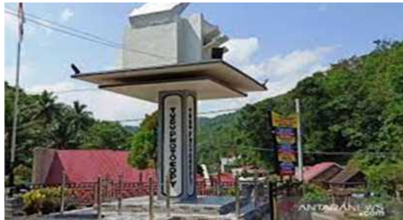
Gambar 4 1.Tugu Photo Copy Nagari Atar