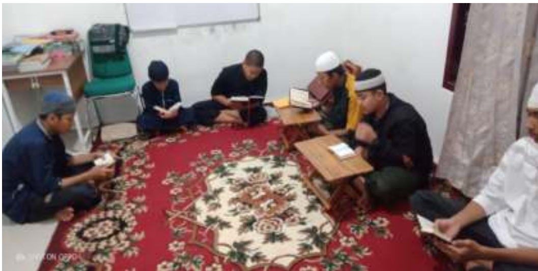
Santri menghafal al Qur'an secara sendiri-sendiri