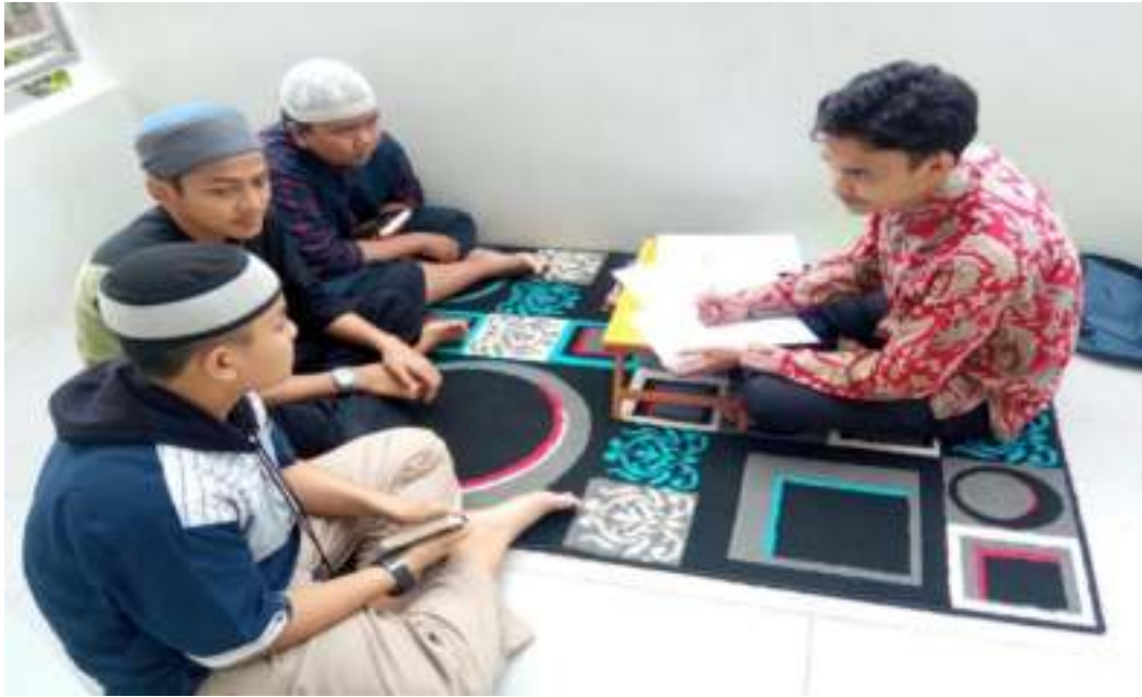
Melakukan wawancara dengan santri