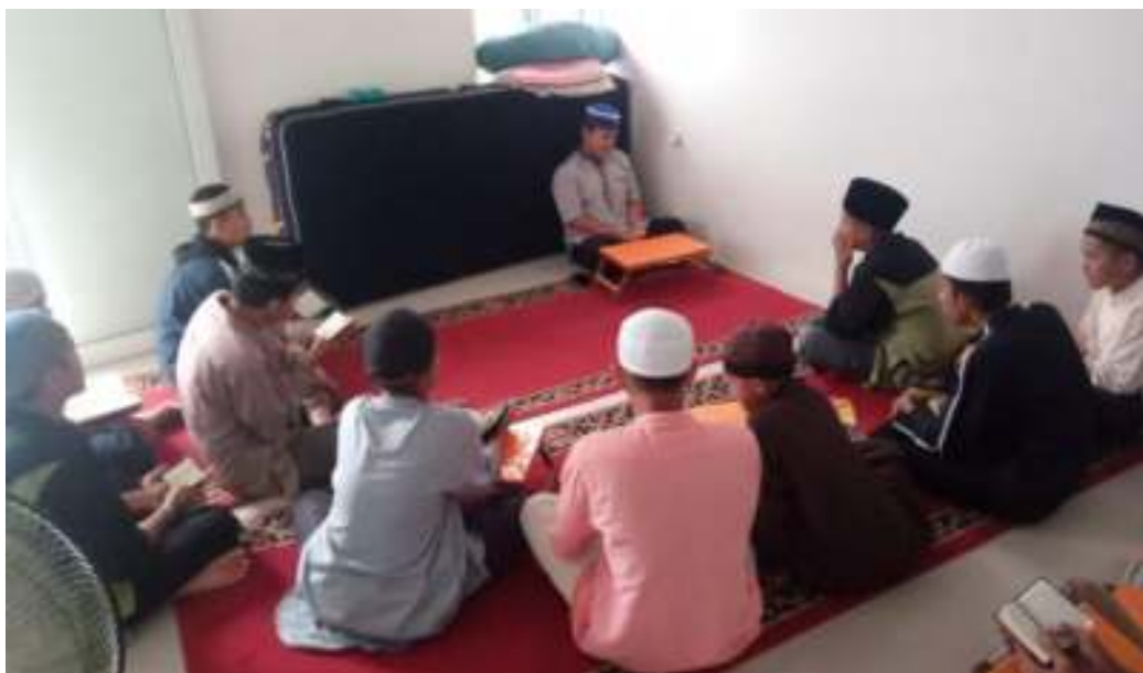
Santri menghafal al Qur'an secara sendiri-sendiri