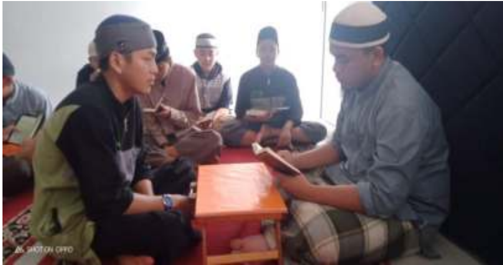
Santri melakukan penyeteran hafalan