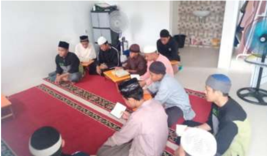
santri menghafal al Qur'an secara sendiri-sendiri