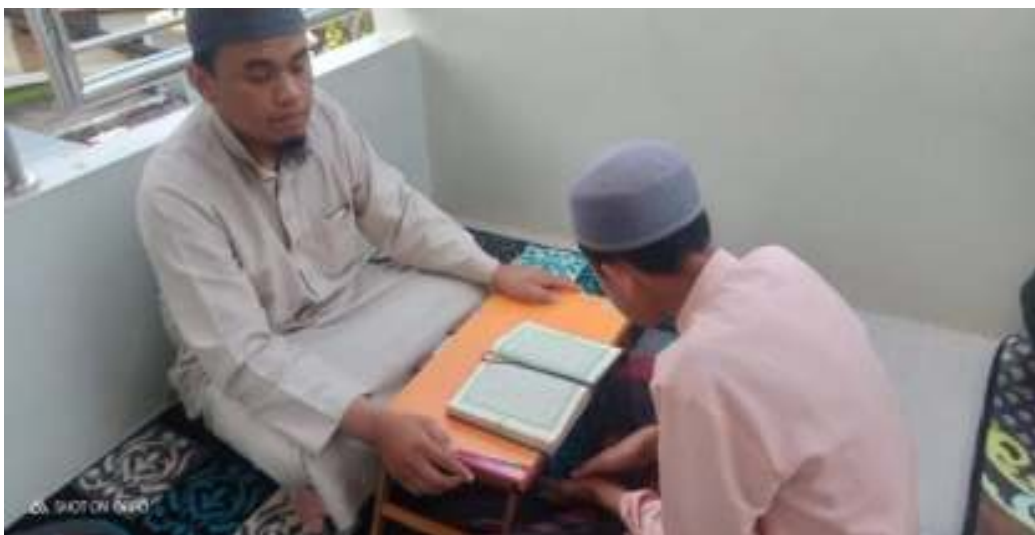
Ustadz membimbing santri yang mengikuti tahsin