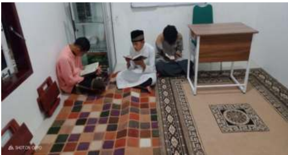
Santri Menghafal al Qur'an sebelum tidur secara sendiri-sendiri