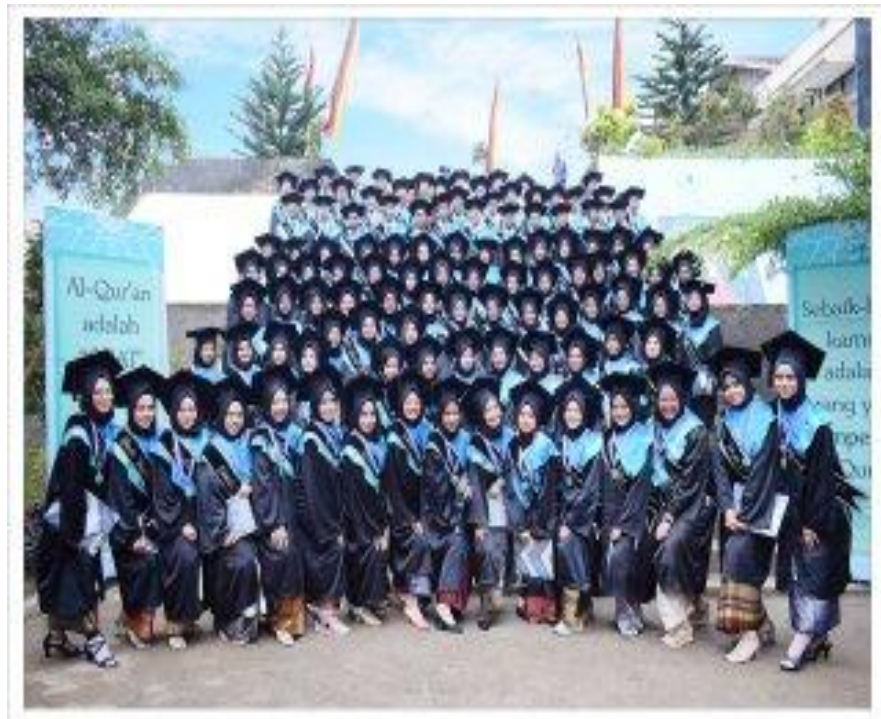
Gambar 4. 4 Foto Wisuda Tahfidz

Dari urian diatas dapat disimpulkan bahwa, dalam proses evaluasi guru tahfidz dapat mengetahui perkembangan setiap siswa. Seperti halnya dalam hasil data yang peneliti peroleh data bahwa guru tahfidz dapat mengevaluasi perkembangan hafalan al-Qur'an siswa pada ujian semester ganjil dan semester genap yang mana nantinya dari hasil ujian tersebut dapat dilihat dalam rapor siswa.