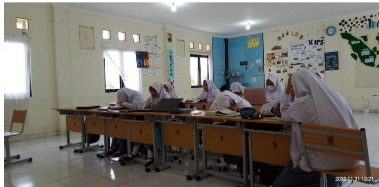
Gambar 4. 3 Muraja'ah Hafalan