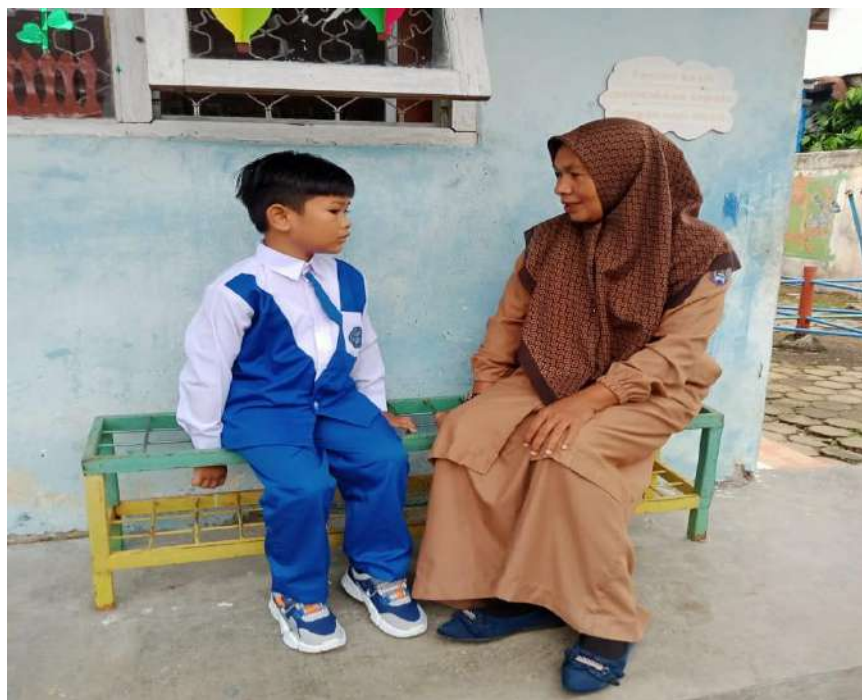
Gambar 7 : Peneliti mewawancarai Subjek 3