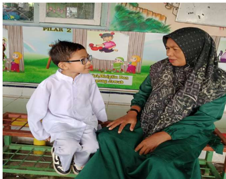
Gambar 3 : Peneliti mewawancarai Subjek 1