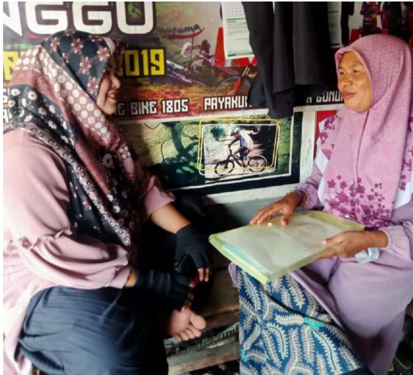
Gambar 4 : Peneliti mewawancarai Informan 2