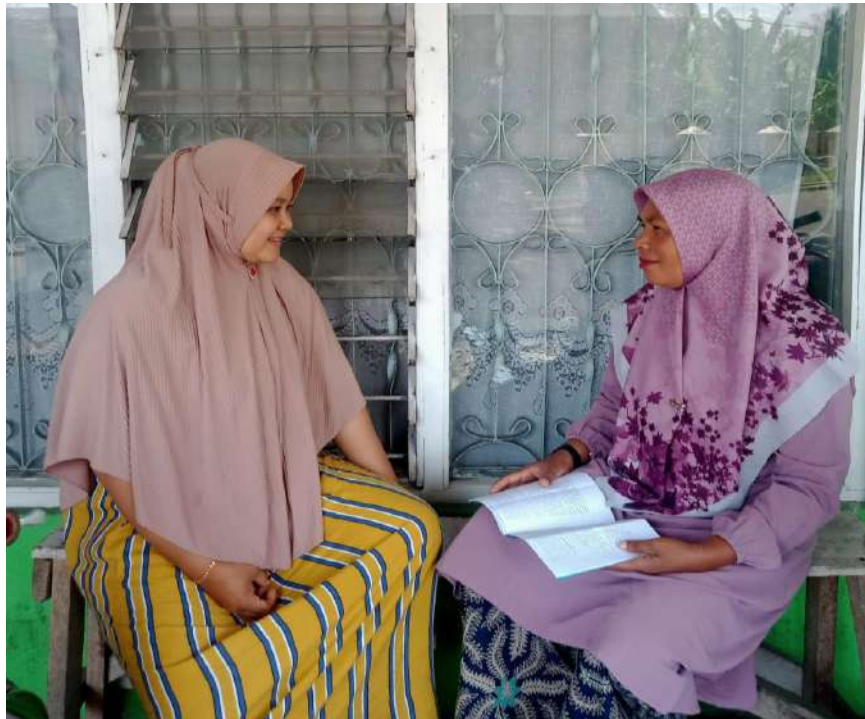
Gambar 6 : Peneliti mewawancarai Informan 3