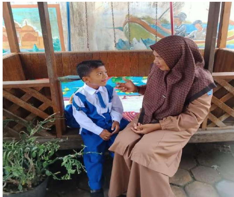
Gambar 5 : Peneliti mewawancarai Subjek 2