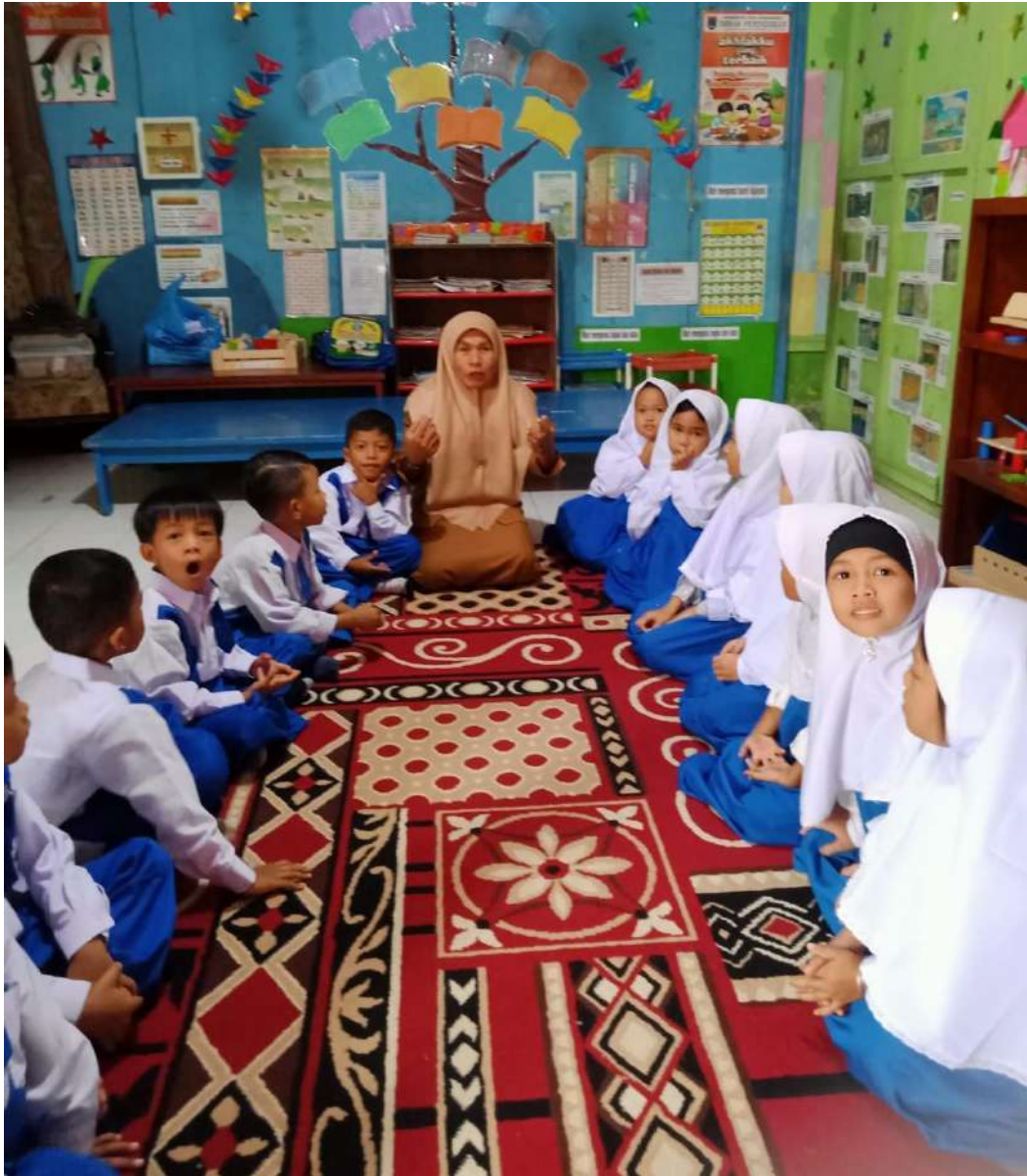
Gambar 1 : Peneliti melakukan wawancara di kelas bersama anak