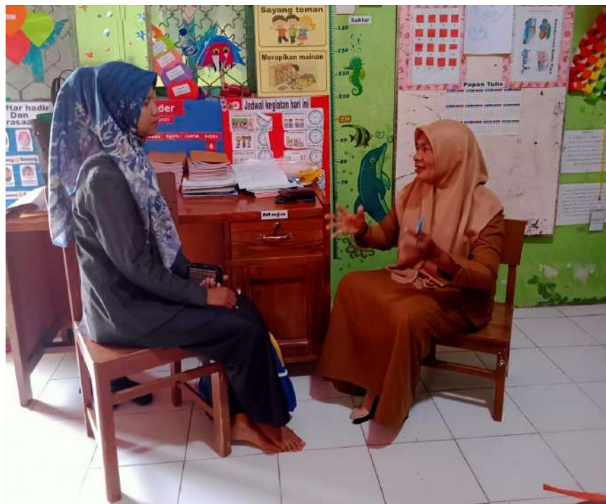
Gambar 2 : Peneliti mewawancarai Informan 1