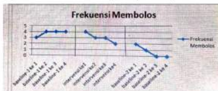
Grafik Perkembangan Frekuensi Membolos Subjek pada Baseline-1 , Intervensi, Baseline-2

Selanjutnya fase intervensi yaitu terdiri dari 4 sesi. Hasil dari pemberian intervensi dapat di lihat 2 hari setelah diberikannya intervensi. Frekuensi membolos dari intervensi ke 1 sampai dengan intervensi ke 4 mengalami penurunan. Pada intervensi ke 1 frekuensi membolos subjek yaitu 4 kali, kemudian pada intervensi ke 2 mengalami penurunan yaitu 3 kali membolos. Pada intervensi ke 3 frekuensi membolos subjek sama dengan intervensi ke 2 yaitu 3 kali. Dan pada intervensi ke 4 kembali mengalami penurunan yaitu 2 kali membolos.