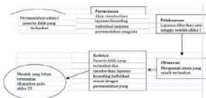
Gambar 2. Siklus 2

Pada pra siklus I, ditemukan peserta didik yang terlambat sebanyak 54 orang pada kelas X di SMK 1 Negeri Gunung Talang. Setelah dilakukan tindakan siklus I peserta didik yang terlambat mengalami penurunan dengan jumlah 16 orang. Dari data tersebut dilakukan tindakan siklus II, hasilnya peserta didik tidak ada lagi terlambat pada kelas X SMK Negeri 1 Gunung Talang. Hasil yang diperoleh dari penelitian ini menyatakan bahwa Layanan Individual dapat meningkatkan disiplin peserta didik. Dari hasil ini maka kegiatan layanan dapat efektif dalam mengatasi ketidak disiplin siswa. Dimana melalui konseling yang dilakukan peserta didik dapat temotivasi untuk disiplin. Pendisiplinan pada peserta didik ini berbeda dari pendekatan biasa yang dilakukan. Dimana melalui aturan dan sanksi ternyata tidak membuat siswa disiplin. Dengan kegiatan konseling siswa dapat menjadi disiplin.