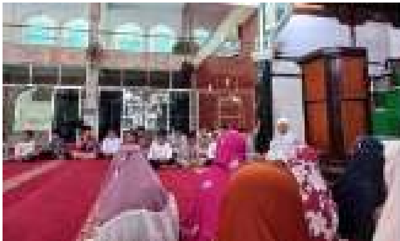
(Pendidik membimbing peserta didik saat didikan subuh)