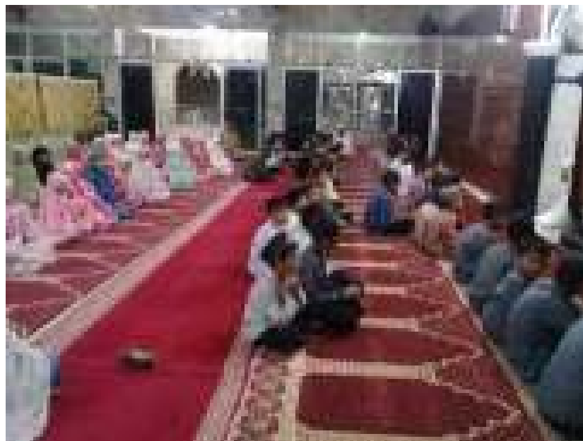
(peserta didik berzikir dan berdoa)

Dari penjelasan tersebut dapat disimpulkan bahwa peserta didik dibina dan dibiasakan untuk berzikir dan berdoa setelah salat. Dari pembinaan berzikir dan berdoa ini peserta didik diharapkan mampu mengamalkannya pada kehidupan sehari-hari.