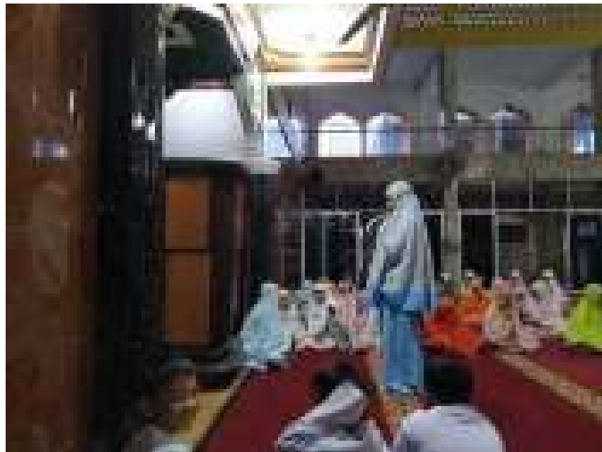
(peserta didik melaksanakan praktek salat duha)

Berdasarkan hasil wawancara tersebut dapat diketahui bahwa praktek salat duha merupakan bagian dari program didikan subuh yang memiliki dampak besar bagi diri seorang anak.