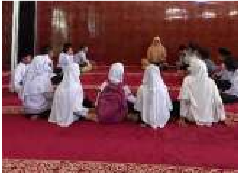
(Peserta didik menghafal Al-qur`an di dalam halaqah)

Berdasarkan hasil wawancara dan observasi tersebut maka dapat diambil kesimpulan bahwa pelaksanaan program Tahfiz Quran di MDTA Nagari Saniangbaka sudah terjadwal dengan baik dan memiliki buku panduan yang resmi sehingga mudah bagi guru dan siswa melihat perkembangan hafalan siswa. Selain itu, para siswa dengan tertib melaksanakan dan menghafal di dalam halaqahnya masing-masing dengan panduan guru. Dari kegiatan ini dapat mempengaruhi akhlak siswa karena dengan hafalan yang dibacanya siswa menjadi tenang dan nyaman.