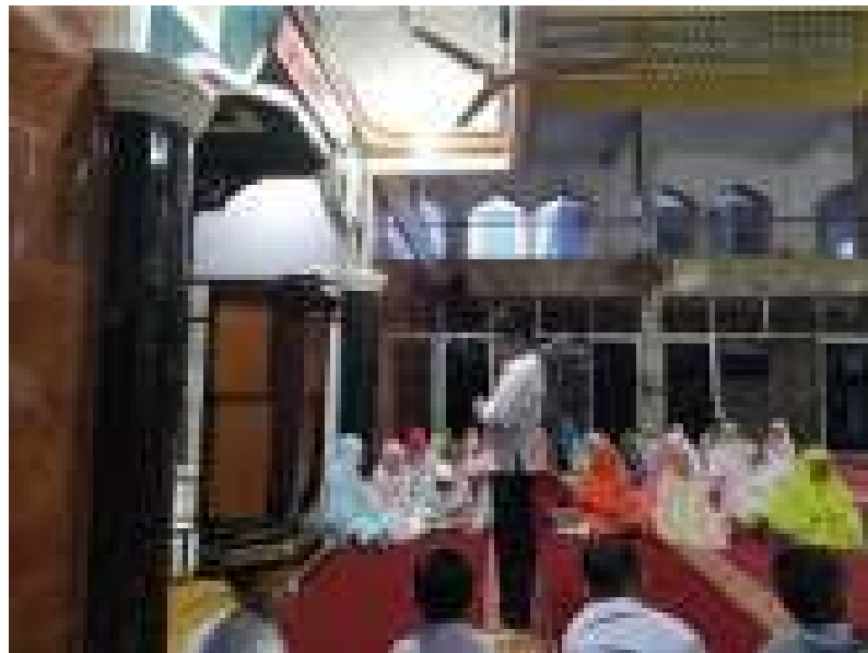
(peserta didik melaksanakan praktek salat jenazah)

Dari pernyataan tersebut dapat disimpulkan bahwa MDTA Masjid Raya mengajarkan dan membina peserta didik terampil dalam menyalatkan jenazah.