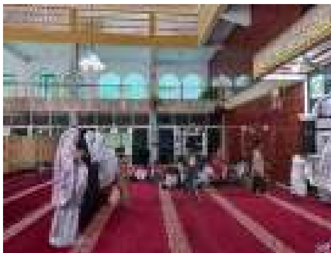
(setelah kegiatan didikan subuh berakhir peserta bersalaman sebelum pulang)

Kegiatan tersebut merupakan program pembinaan pengamalan beragama yang diterapkan di MDTA Nagari Saniangbaka untuk membentuk lingkungan madrasah yang kondusif dengan semangat kekeluargaan, keakraban, dan kehangatan dengan menghargai orang lain, disiplin, dan bertanggung-jawab. Dari kegiatan tersebut para peserta didik menjadi terbiasa menyapa dan berjabat tangan serta mengucapkan salam dengan orang tua, teman-teman, guru, dan masyarakat sekitarnya.