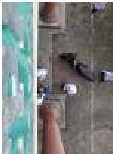
(peserta didik membersihkan lingkungan MDTA)

Berdasarkan pernyataan tersebut, dapat disimpulkan bahwa kegiatan gotong royong dalam membina akhlak anak usia dini dilaksanakan setelah didikan subuh. Selain itu, pendidik langsung membimbing dan ikut serta dalam kegiatan tersebut. Pembinaan ini dilaksanakan untuk melatih peserta didik agar selalu menjaga lingkungan sekitar dan menerapkan pola hidup bersih.