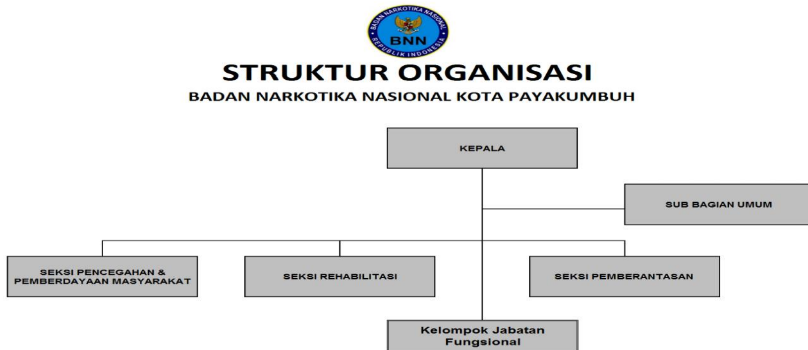
Gambar 4.1 Struktur Badan Narkotika Nasional (BNN) Kota Payakumbuh

Badan Narkotika Nasional Kota Payakumbuh Jl. Kampung Baru Bukik Sikumpa, Kel. Padang Karambia, Kec. Payakumbuh Selatan, Kota Payakumbuh, Provinsi Sumatera Barat Telp : (0752) 90789 Fax : (0752) 95815 E-mail : bnkpyk@yahoo.com