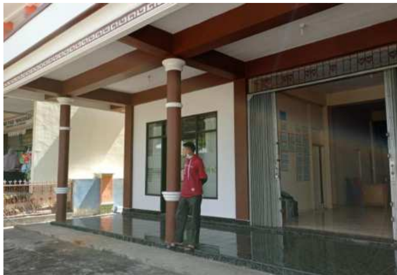
Gambar 3. Foto kantor UPK Kec. Lima Kaum DAPM Mandiri Perdesaan