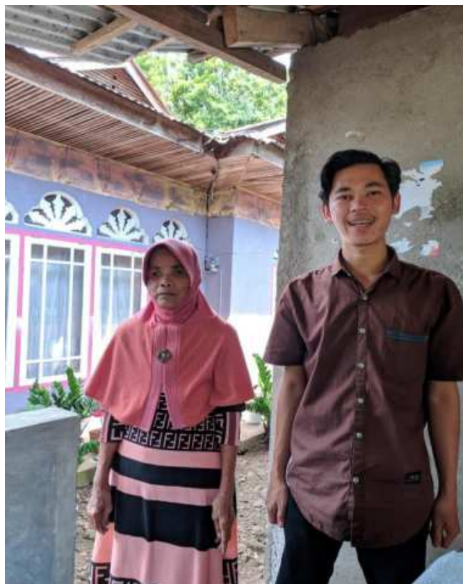
Gambar 5. Wawancara dengan anggota kelompok peminjam Saiyo Sakato Tigo