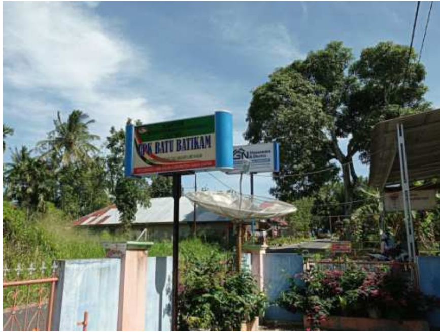
Gambar 4. Foto kantor UPK Kec. Lima Kaum DAPM Mandiri Perdesaan