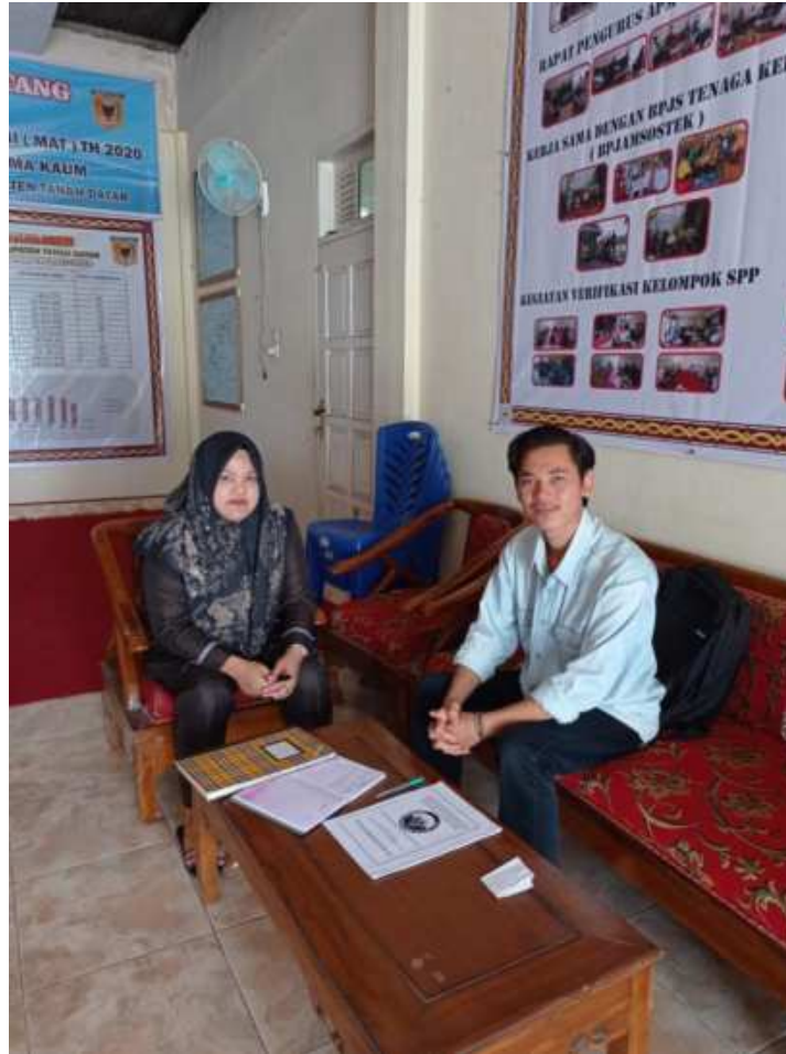
Gambar 2. Foto wawancara dengan pengurus DAPM Mandiri Perdesaan