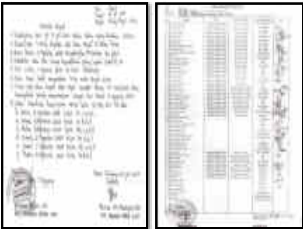
Gambar 1. Hasil Rapat dan Absensi Rapat

Hal tersebut di atas ditandai dengan adanya bukti fisi tentang hasil rapat dan absensi ketika rapat, yaitu: