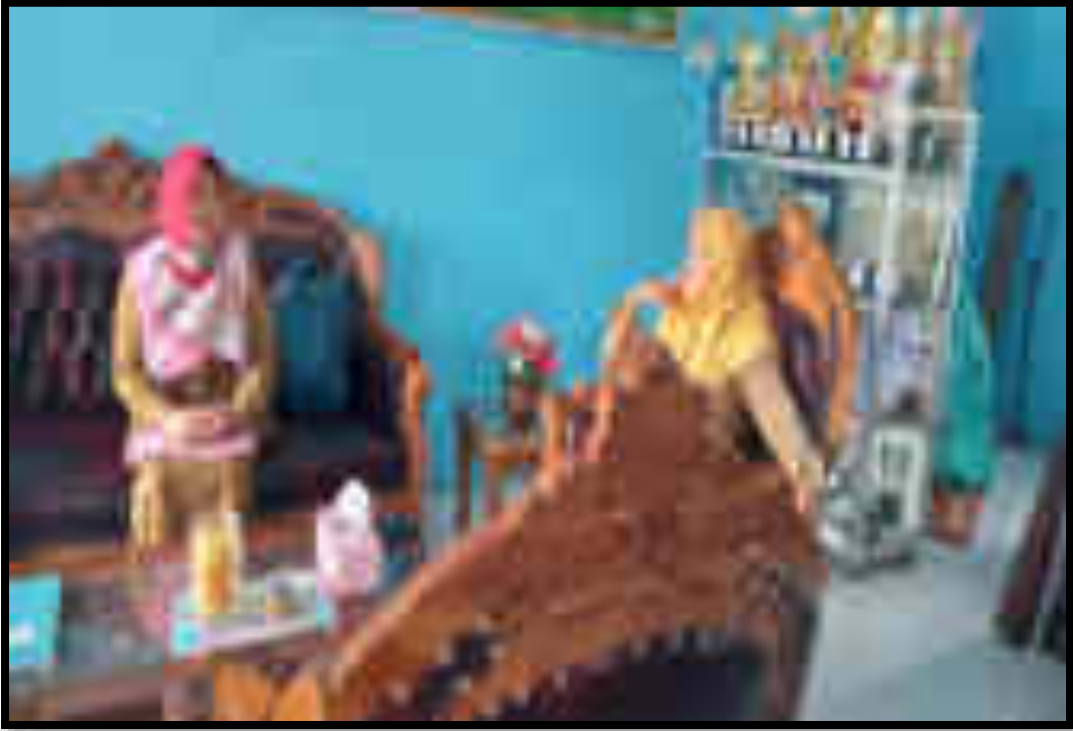
Gambar 5. Wawancara dengan Kepala Sekolah