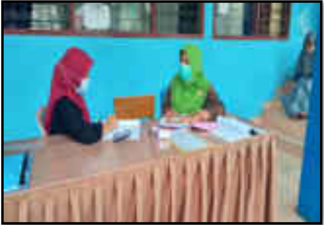
Gambar 9. Wawancara dengan Guru 4