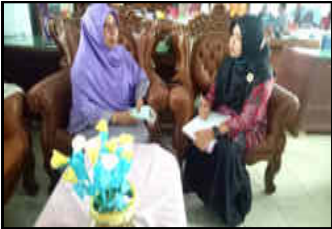
Gambar 7. Wawancara dengan Guru 2