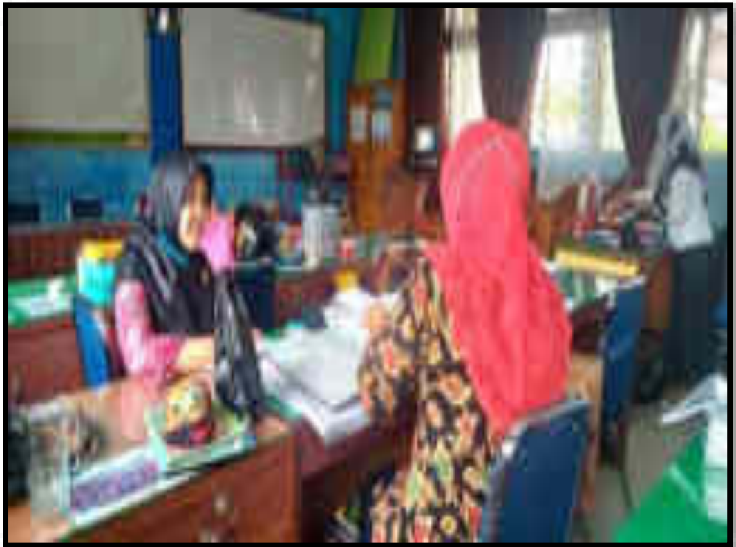
Gambar 10. Wawancara dengan Guru 5