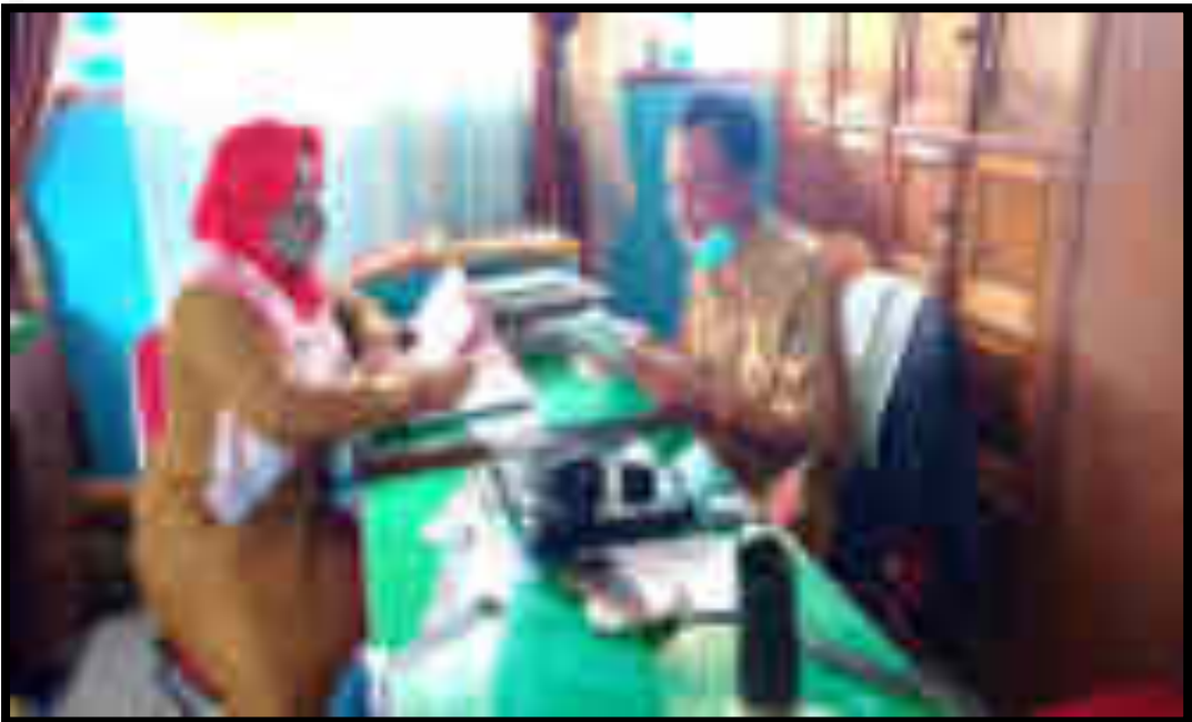
Gambar 6. Wawancara dengan Guru 1