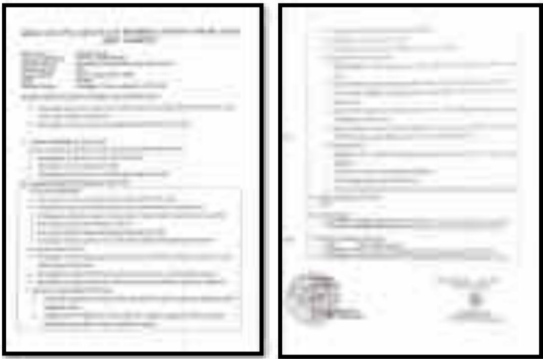
Gambar 2. Salah Satu RPP Guru

Hal tersebut di atas, sebagaimana perencanaan perangkat pembelajaran dalam gambar di bawah ini yaitu: