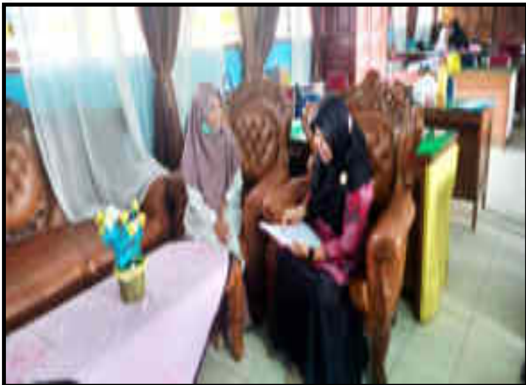
Gambar 8. Wawancara dengan Guru 3