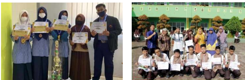
Gambar 11: Prestasi siswa SMP Islam Raudhatul Jannah Payakumbuh

Nilai-nilai karakter dapat juga ditanamkan melalui kegiatan pembelajaran. Kegiatan yang dapat membuat peserta didik untuk memiliki sikap tanggung jawab, kerja keras, percaya diri dan kreatif. Terbukti dengan sikap yang dimiliki oleh siswa SMP Islam Raudhatul Jannah Payakumbuh menjuarai berbagai macam perlombaan yang di adakan oleh SMA Negeri 2 Kota Payakumbuh.