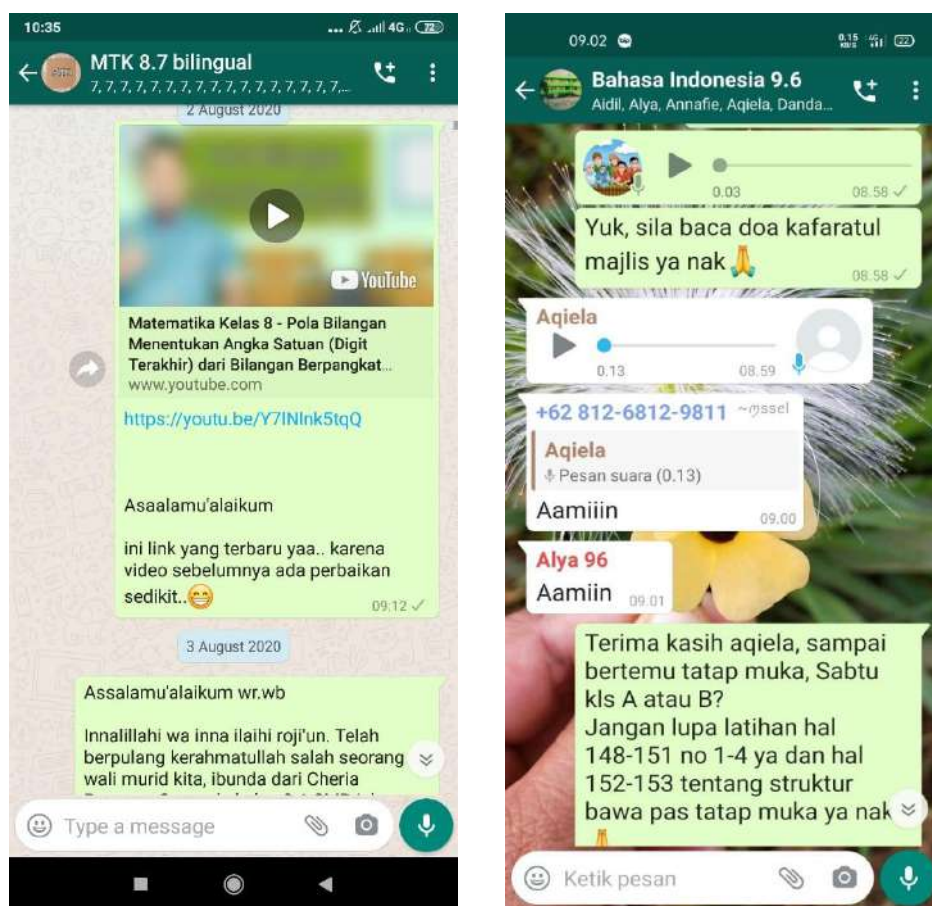
Gambar 8 : Aktivitas Pembelajaran Menggunakan whatsapp grup

Berdasarkan penjelasan di atas bentuk pelaksanaan pembelajaran selama masa new normal ini dilakukan secara daring dan tatap muka terbatas. Secara daring guru menggunakan aplikasi google classroom dan whatsapp grup untuk mempermudah dalam menyampaikan materi pembelajaran. Guru juga memantau semua kegiatan pembelajaran siswa melalui agenda harian. Melalui proses pembelajaran berlangsung guru menanamkan nilai-nilai karakter serta melakukan evaluasi dan tindak lanjut dari proses pembelajaran berlangsung.