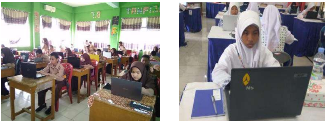
Gambar 2 Kelas Digital SMP Islam Raudhatul Jannah

SMP Raudhatul Jannah yang merupakan salah satu sekolah Islam swasta di Kota Payakumbuh yang memiliki akreditasi A dan program unggulan seperti kelas digital, kelas tahfizh, dan bilingual. SMP Islam Raudhatul Jannah telah mulai dilirik oleh masyarakat sebagai sekolah yang berusaha untuk menata manajemen peningkatan mutu pendidikan secara terbuka dan transparan. Hal ini dibuktikan dengan prestasi yang telah dicapai oleh SMP Islam Raudhatul Jannah Payakumbuh, baik dibidang akademik maupun non akademik.