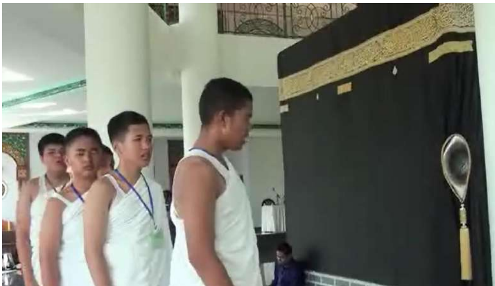
Gamabar 3: Praktik Manasik Haji

SMP Islam Raudhatul Jannah Payakumbuh memiliki visi yaitu Unggul Imtaq, Iptek, Berprestasi, Mandiri dan Komunikatif Untuk Kejayaan Islam. Dan misinya yaitu 1) meningkatkan pengetahuan, pemahaman dan pengamalan ajaran islam. 2) Mengembangkan sikap kemandirian, kepemimpinan, kewirausahaan secara individu dan berkelompok. 3) Meningkatkan prestasi akademik dan non akademik peserta didik di tingkat regional, nasional dan internasional. 4) Mendidik peserta didik untuk menguasai teknologi informasi. 5) Menjadikan pendidikan yang berkesinambungan. 6) Meningkatkan kemampuan peserta didik berbahasa Indonesia, Arab dan Inggris baik aktif maupun pasif.