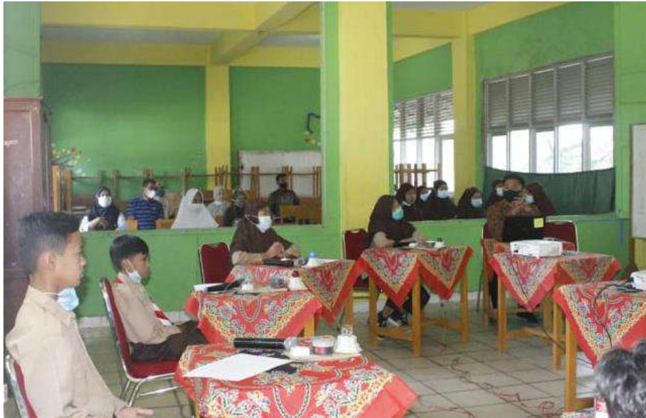
Gambar 10 : Pelaksanaan Lomba Baca Pidato dan Puisi

Fungsi pendidikan karakter karakter adalah untuk mengembangkan potensi dasar seorang anak agar berhati baik, berperilaku baik, serta berpikiran baik. Kemudian fungsi besarnya untuk memperkuat serta membangun perilaku anak bangsa yang multikultur. Selain itu pendidikan karakter juga berfungsi meningkatkan peradaban manusia dan bangsa yang baik di dalam pergaulan dunia. Salah satu bentuk penerapan pendidikan karakter termuat dalam mata pelajaran Pendidikan Agama Islam sebagaimana dijelaskan oleh Farid sebagai berikut: