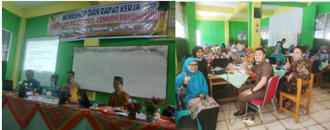
Gambar 6 : Foto Rapat Kerja Awal Tahun Pelajaran

Mengenai kesesuaian program pendidikan karakter dengan visi, misi dan tujuan SMP Islam Raudatul Jannah Payakumbuh dijelaskan sebagai berikut: