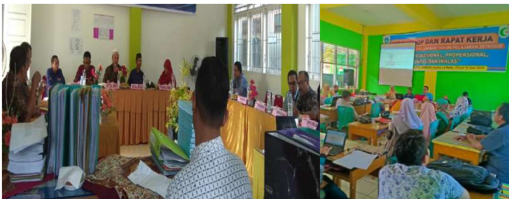
Gambar 5 : Kegiatan Musyawarah dengan Pengawas

Di dalam menjalankan program-program sekolah, SMP Islam Raudhatul Jannah Payakumbuh menggunakan strategi kepengawasan berbasis manajemen keluarga dalam meningkatkan prestasi sekolah. Di dalam tugas kepengawasan, pengawas sekolah mengajak warga sekolah untuk duduk bersama, bermusyawarah mulai dari perencanaan, pelaksanaan dan evaluasi. Kemudian semua komponen berupaya melaksanakan tugas dan fungsinya masing-masing dalam mencapai tujuan sekolah berprestasi.