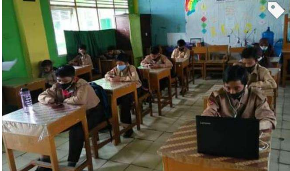
Gambar 9: Pelaksanaan Pembelajaran Tatap Muka Secara Terbatas

Berdasarkan gambar di atas jelas sekali SMP Islam Raudhatul Jannah Payakumbuh melaksanakan kegiatan pembelajaran tatap muka secara terbatas. Seluruh siswa diwajibkan untuk mematuhi protokol kesehatan dengan cara menjaga jarak, memakai masker. Kegiatan pembelajaran tatap muka terbatas ini dilaksanakan dengan tujuan membantu kesulitan peserta didik dalam memahami materi pembelajaran secara daring. Pembelajaran secara ini juga dapat memantau perkembangan sikap siswa dalam hal disiplin dan tanggung jawab.