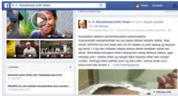
Gambar 2. Postingan Jumlah Komentar Tertinggi

anak itu. Berikut adalah gambar dari postingan yang jumlah komentarnya banyak: