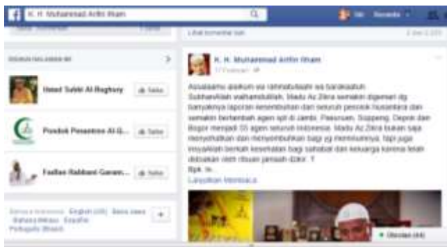
Gambar 3. Postingan Jumlah Komentar Paling Sedikit

Selanjutnya jumlah komentar yang paling sedikit itu tentang madu Az-Zikra dengan jumlah 351. Komentarnya sedikit dikarenakan postingan ini bukan pesan dakwah yang murni melainkan iklan dan promosi dari bisnisnya ustadz Arifin Ilham. Berikut gambar dari postingan yang jumlah komentarnya paling sedikit: