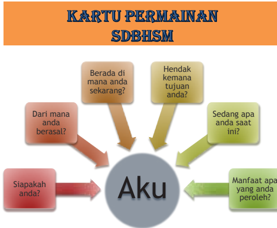
Gambar 2. Kartu Permainan SDBHSM Side B

Melalui media kartu SDBHSM, konseli diminta untuk menjawab enam pertanyaan pada kartu side A dalam kertas kosong yang tersedia kemudian konselor mengeksplorasi setiap jawaban konseli secara bertahap dari nomor 1 sampai nomor 6. Konselor melakukan konfrontasi atas jawaban konseli agar konseli sampai kepada kesadaran penuh yang diharapkan. Kesadaran penuh yang diharapkan dibangun melalui berbagai cara dengan berbagai media seperti google map, video, gambar dll. Google map digunakan untuk menyadarkan konseli berada di mana hakikatnya saat ini. Media video tentang terbentuknya manusia dari pembuahan sampai usia lanjut untuk menyadarkan konseli mengetahui hakikat siapa dirinya dan dari mana berasal. Pada prinsipnya konselor menggiring konseli menemukan hakikat dirinya melalui bimbingan dan menemukan jawaban yang benar tentang enam pertanyaan dalam kartu sesuai dengan jawaban yang benar dalam pandangan Islam.