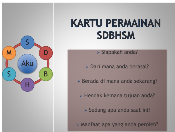
Gambar 1. Kartu Permainan SDBHSM Side A

Kartu SDBHSM sebagai best practice dalam media bimbingan dan konseling, digunakan sebagai media utama treatment. Kartu SDBHSM dapat disekripsikan sebagai berikut, kartu memiliki dua sisi (side A dan B) berisi enam pertanyaan yang sama dengan isi pertanyaan kepanjangan dari SDBHSM. Berikut adalah gambar kartu permainan SDBHSM: