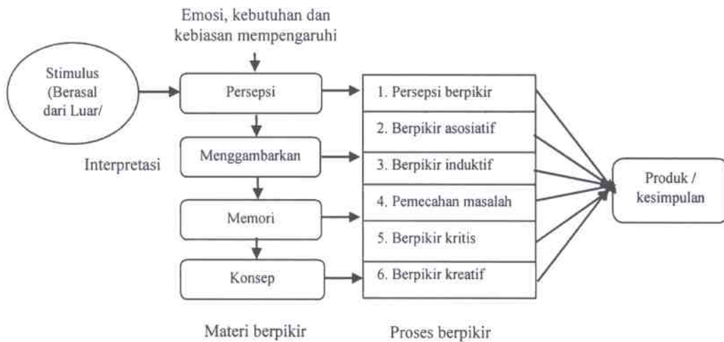
Gambar 1. Alur implikasi berpikir dalam pendidikan (Dimodifikasi dari Burton et. al , 1960 ; (Kantowitz & Roediger, 1984)

Implikasi berpikir dalam pendidikan/pembelajaran, memiliki alur dan proses yang cukup jelas dan memahami alur dan proses tersebut tidaklah sulit. Tetapi, bagi seorang dosen menjadi tugas yang berat tetapi mulia untuk mengajarkannya. Menurut Russel (1956, dalam Burton et al , 1960) alur berpikir yang bisa dipahami oleh mahasiswa dan dosen diawali dengan adanya stimulus, kemudian diinterpretasikan, dilanjutkan dengan proses dan diakhiri dengan lahirnya kesimpulan. Skema berpikir dalam pendidikan terlihat di bawah ini: