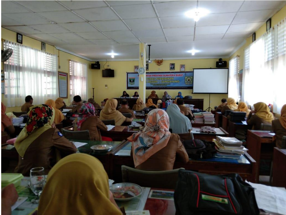
Lampiran 16: Sampel Foto Kegiatan Pengumpulan Data Melalui Penyebaran Angket Foto Kegiatan Pengumpulan Data di SMAN 1 Sungayang